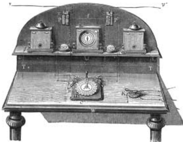
Mesa telegráfica con aparatos Bréguet que podría parecerse a la de Roque Llobet para los ferrocarriles. En el tablero a la derecha se ve un conmutador y en el centro el transmisor; tras éste y en el estante, el receptor, entre timbres avisadores y otros elementos (del libro de George B. Prescott, Electricity and the electric telegraph , New York, 1877).