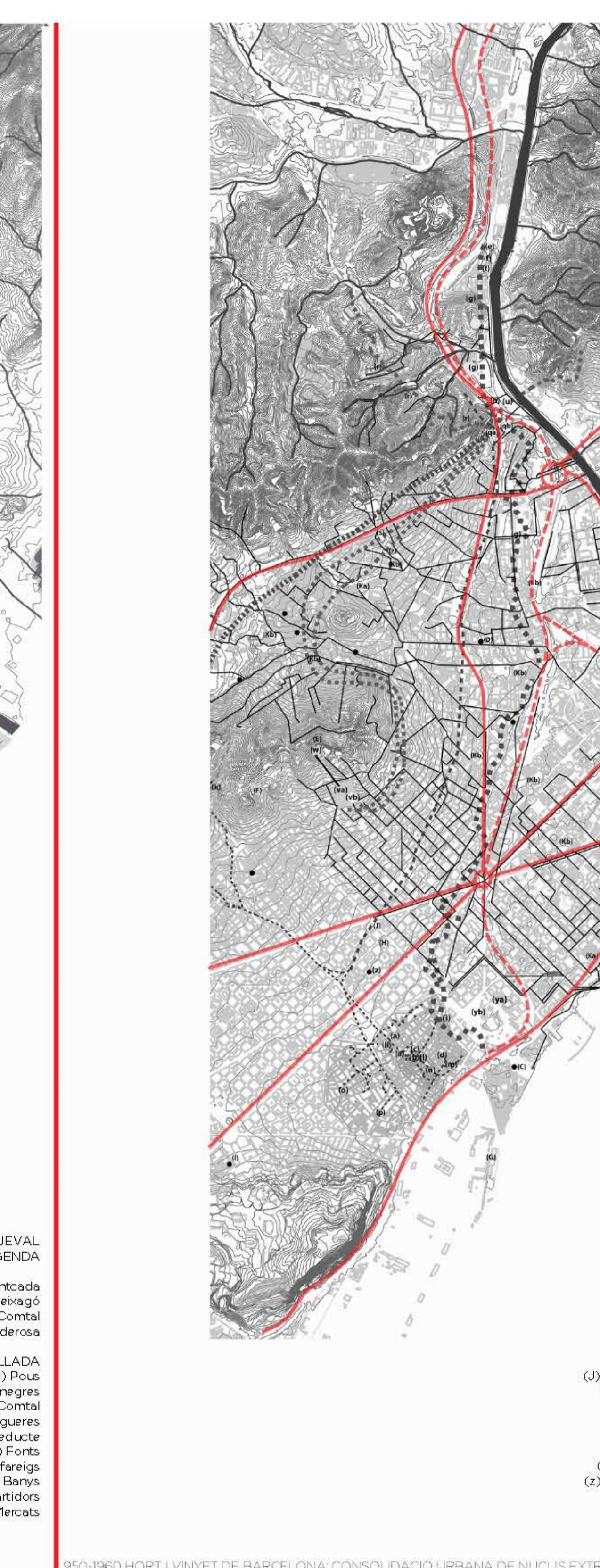
1850-1960 HORT I VINYET DE BARCELONA: CONSOLIDACIÓ URBANA DE NUCLIS EXTRAMURS. REC COMTAL

1854 SEGONA LÍNEA DE FERROCARRIL DE Bcn PARALLELA AL REC COMTAL Recs dels riu Besòs, Sant Miquel, Sant Martí, etc. a Barceloneta 1807 Pla d'ACTIUA DE VAMPLE LA PLANA SEGUNT LA MODULACIÓ ROMANA 1902 METRO DE BARCELONA L1 1936-39 Guerra civil 1945 Arxivo dels assentaments de Baro de Viver i Bon Pastor a Barcelona 1952-57 Construcció de Avinguda Meridiana paral·lela a la Strada Francina 1975 CANALITZACIÓ DEL RIU BESÓS 1992 JUDICÍ - La delimitació de la indústria de arts de la ciutat 1992 CONSTRUCCIÓ DE LES RONDES I NUSOS 2025 Arxivo de VIVE entre paraca a la Sagrada i Santc COBRIMENT DE VIES (PARC PARALLEL LA MERIDIANA