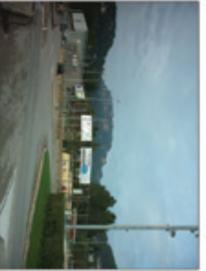
VISUAL 5: Eix que marca la linealitat dels futurs edificis, enquadrant les vistes cap a la Mola.