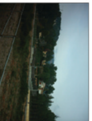
VISUAL 2: Direcció la Mola