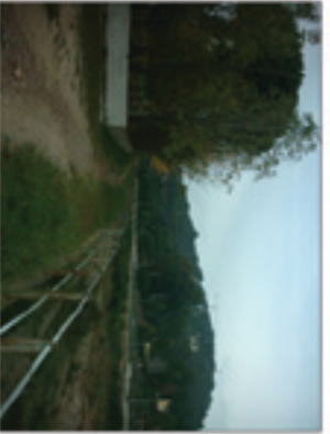
VISUAL 4: Itinerari venjant la riera