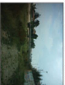
3er element: la riera de les Arenes