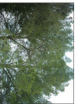
Vegetació autòctona a respectar

El treball principal d'aquest eix sorgeix de l'entorn previ de la connexió dels fluxos de circulacions principals, que estableixen la zona més densa de la ciutat (cauc antic) amb la zona de projecte, la nova àrea esportiva de Matadepera.