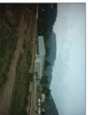
VISUAL 4: Itinerari venjant la riera amb visuals cap a la Mola