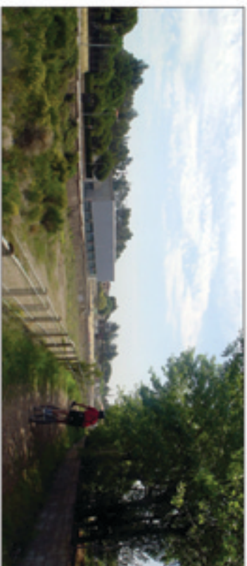
VISUAL 3: Vers la futura àrea d'equipaments i plataforma de pas