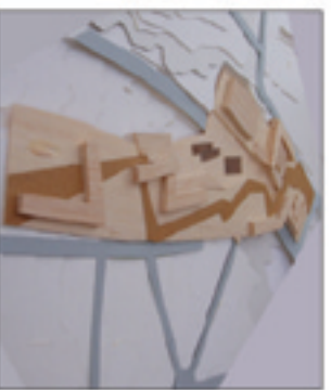
Maqueta que mostra l'eix promotor del projecte urbanístic.

El tema considerat, desenvolupat com a projecte final de carrera, és el corresponent a l'equipament esportiu: piscina coberta, que s'ubicarà en els terrenys pertanyents a l'antic camp de futbol.