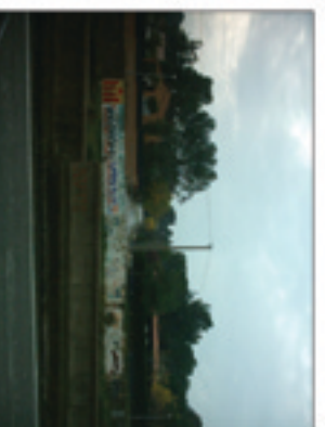
VISUAL 6: Projectació visual cap a carrers ja existents.