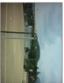
2n element: camp de futbol existent que serà traspassat