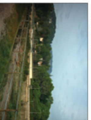
VISUAL 11: Direcció la Mola