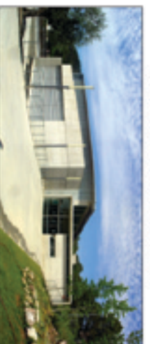
1er element: parvèl·l poliesportiu existent