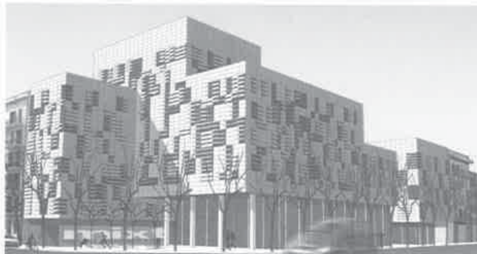
PFC D'EDUARD BALCELLS

L'any 2004, s'inicià el costum d'exposar els millors projectes finals, de carrera al vestíbul de l'ETSAB, una iniciativa més de la Direcció per millorar i prestigiar aquesta instància acadèmica, tan important per a la nostra institució.