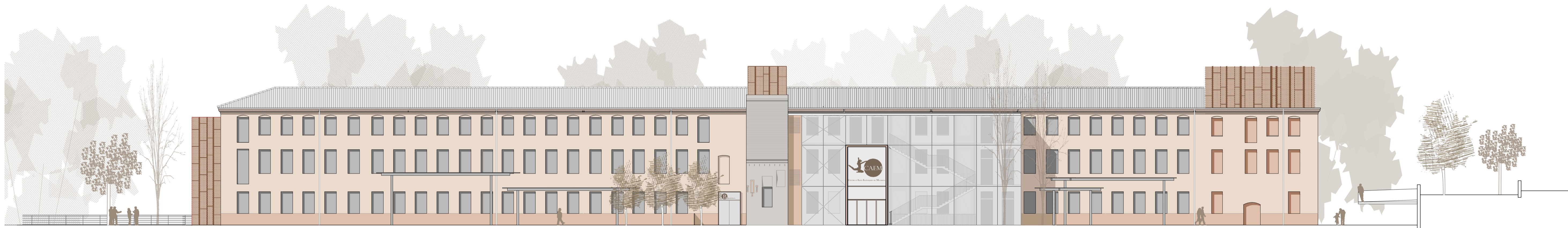
ALÇAT EST E:1/200