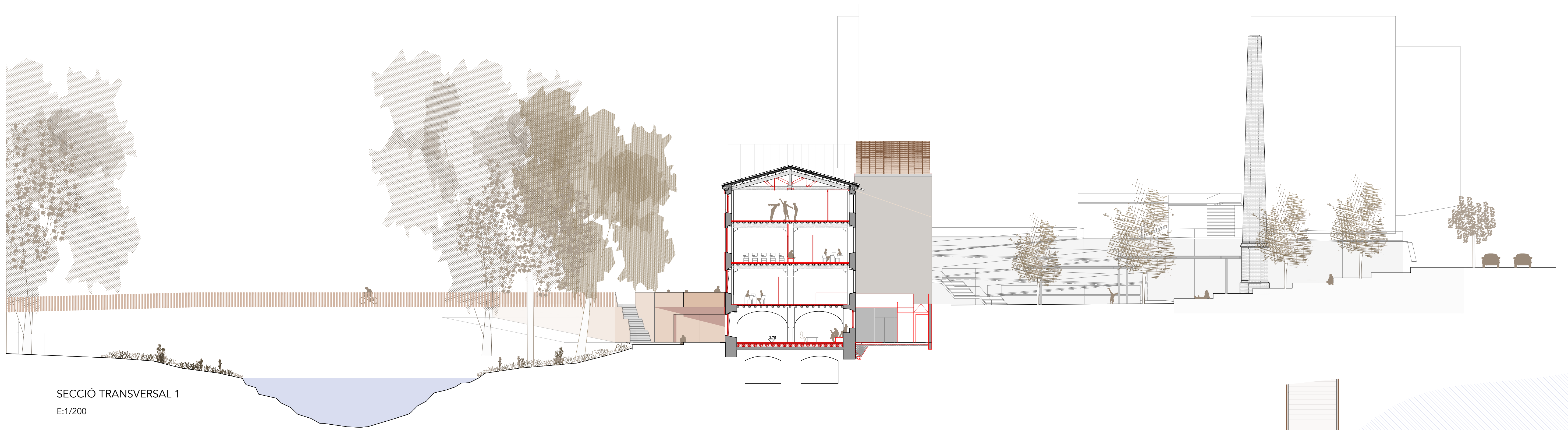
SECCIÓ TRANSVERSAL 1 E:1/200