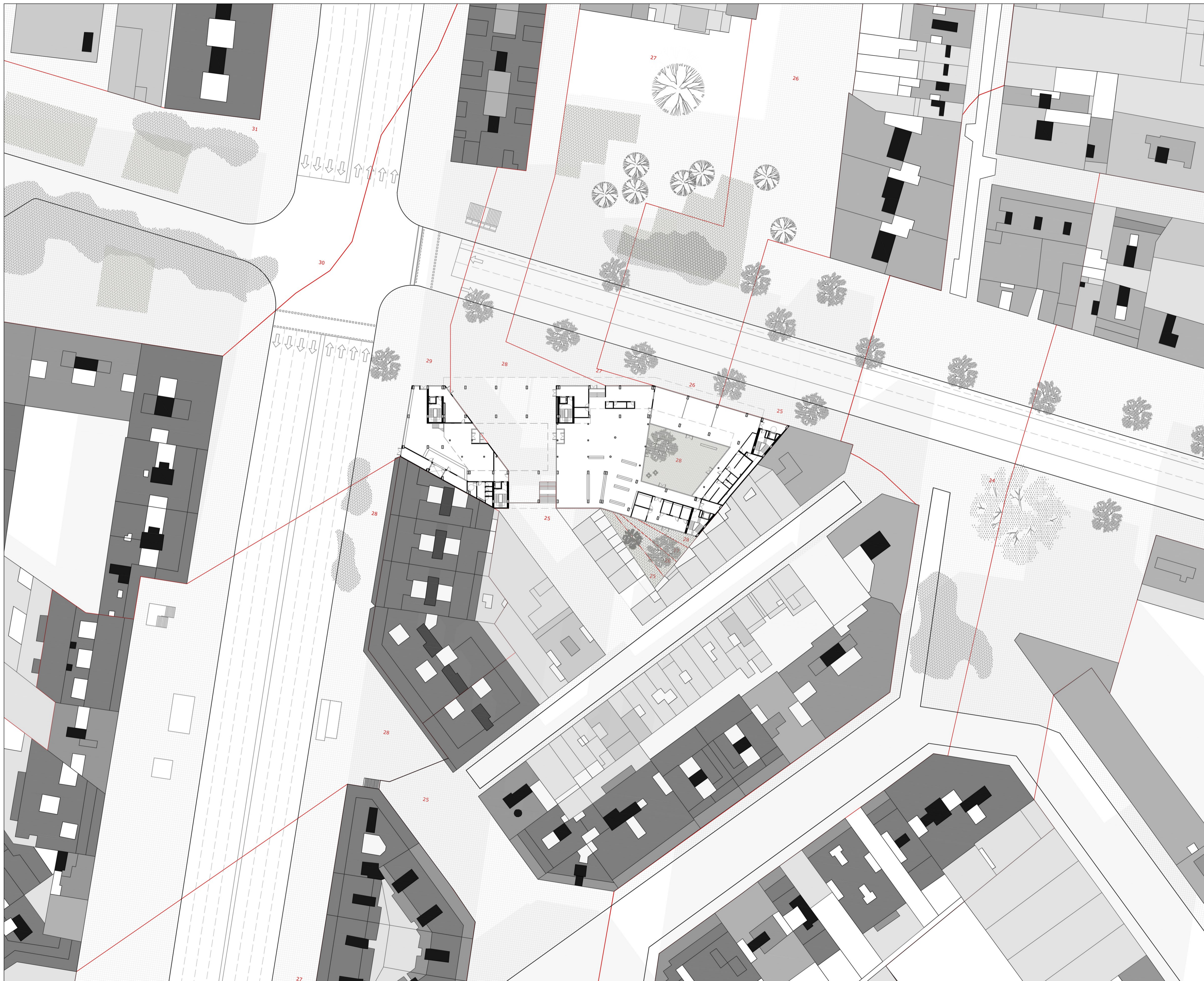
Encontre amb el sòl