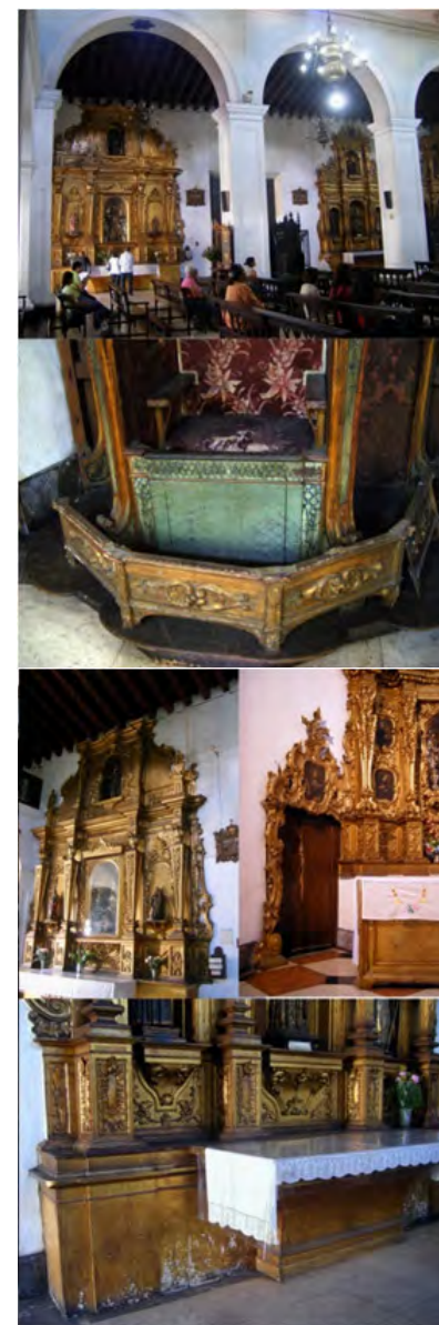
Fig. 82. Iglesia San Francisco, Caracas.