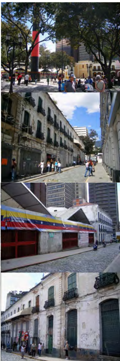
Fig. 83. Alrededores Plaza San Jacinto, Caracas.

plaza El Venezolano están en un estado deplorable. Como dice Gasparini, “ es un ejemplo de cómo se impone la incompetencia, la ignorancia y el servilismo al abuso de la ineficiencia ” 2 . Les dejo las imágenes de finales del 2010.