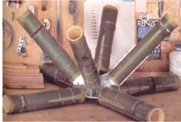
318.1. Uniones mecánicas en bambú (Renzo piano derecha)