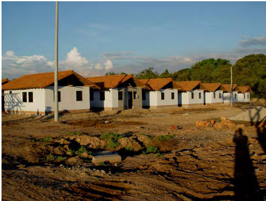
318. Proyecto de viviendas de interés social de Simón Vélez-2003

¿Es posible llegar a la industrialización y sistematización de las técnicas constructivas en guadua en Colombia?