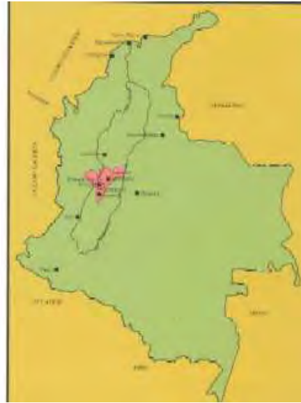
El Viejo Caldas en Colombia

El sector de la cordillera Central correspondiente al Viejo Caldas está conformado por una cadena volcánica en la cual se destacan los páramos de la Línea, Quindío, Santa Rosa de Cabal, Nevado del Ruiz y los páramos de Letras y Cerro Bravo, en algunos de cuyos puntos se alcanzan alturas hasta de 5.400 metros sobre el nivel del mar.