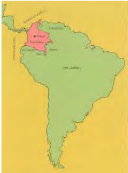
1. Colombia en América

País : Colombia Sub-Región : El Viejo Caldas Continente : América del Sur Habitantes : 46.5000.000