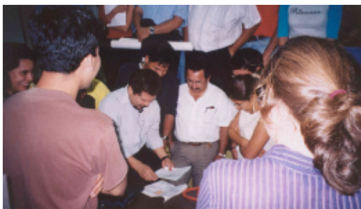
Fig.4 – Clases prácticas en taller