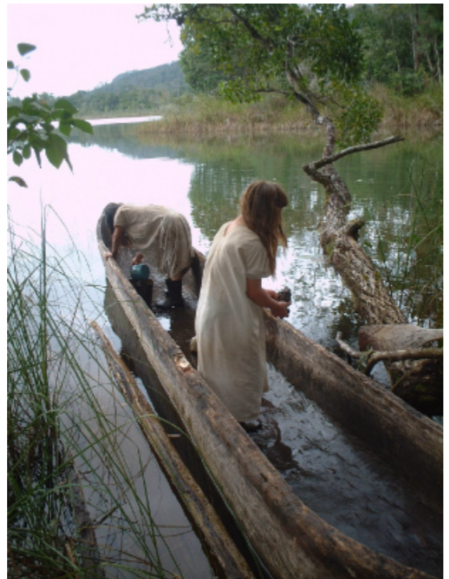
Fig. 5 – Paseo en canoa por la Laguna