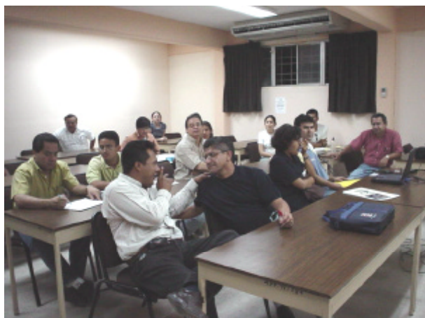
Fig. 6 – Clases de taller en grupos

Todas las propuestas arquitectónicas se definieron sobre la base de una estancia acotada en el tiempo definido por los propios alumnos y así mismo motivada por una actividad propuesta por cada grupo de trabajo.