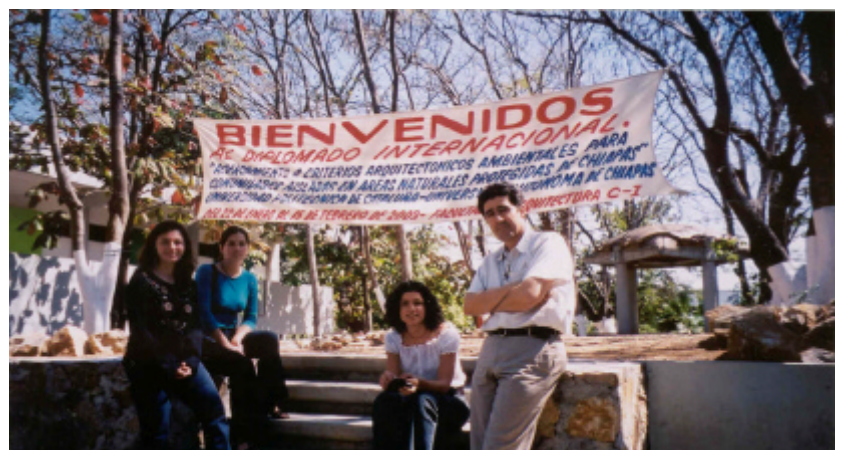
Fig. 1- Profesores organizadores del curso de la Escuela de Arquitectura de la UNACH

Últimamente, la preocupación mundial por la naturaleza existente promueve poco a poco el interés por recuperar estos conocimientos medioambientales que antiguamente pertenecieron a la propia cultura social.