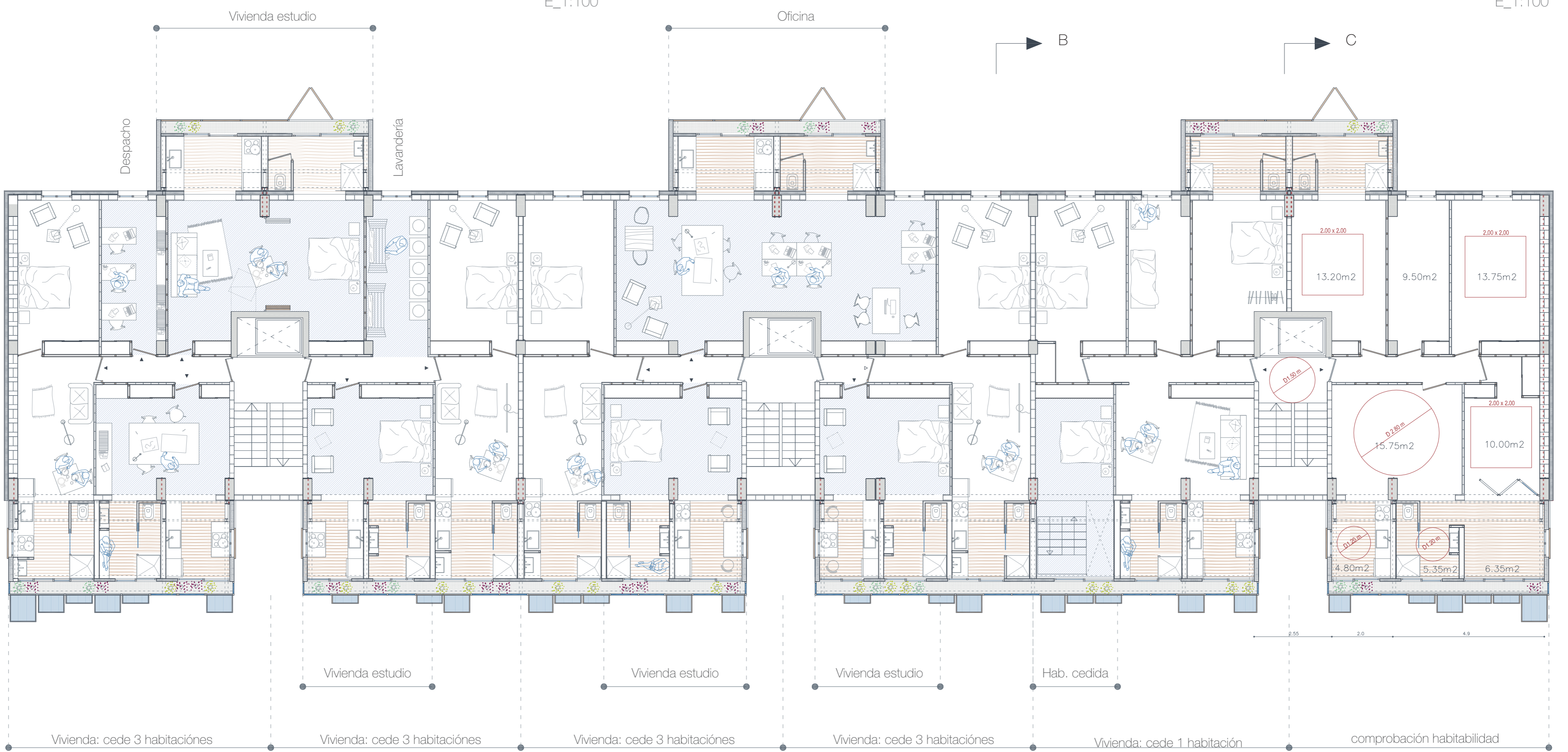
PLANTA 2. APLICACIÓN DEL SISTEMA E_1:100