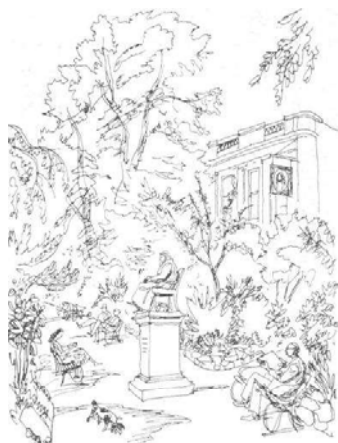
ILUSTRACION no. 1 EL AMBIENTE Y LA PSICOLOGIA

La psicología ambiental es el resultado del esfuerzo profesional y académico de varias disciplinas, a lo largo de su corta existencia se le haya denominado de varias formas, como arquitectura conductual, psicología de la arquitectura, geografía conductual, ecología psicológica, psicología del entorno y estudios ambiente comportamiento entre otras.