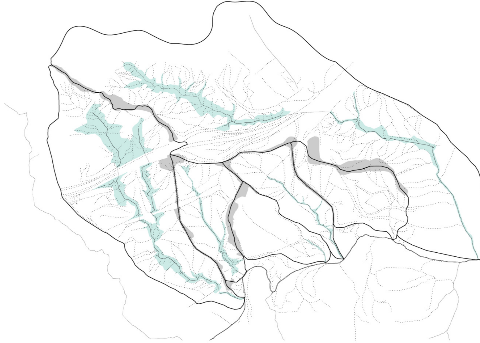
Cuenca de la Riera de Sant Cugat

El objetivo principal es el de GENERAR una nueva actividad económica que permita REACTIVAR la antigua industria cerámica y PROPICIAR así el primer tramo de la Via Verde entre Collserola y Sant Llorenç de Munt.