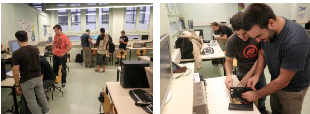
Fig. 2.- Aspecte general del laboratori de l'assignatura durant una sessió d'AD en què es treballa en el muntatge i assaig del prototip que es porta a terme.