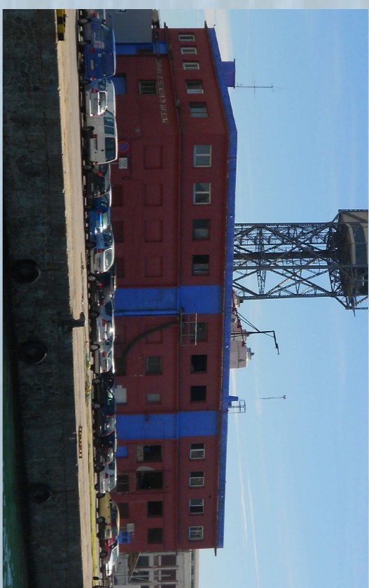
2. Fàbrica de gel