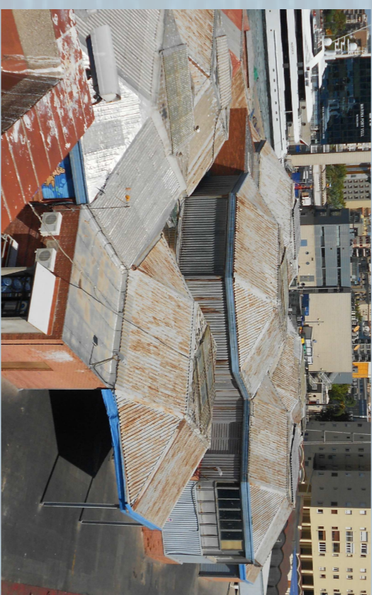
4. La llotja del peix