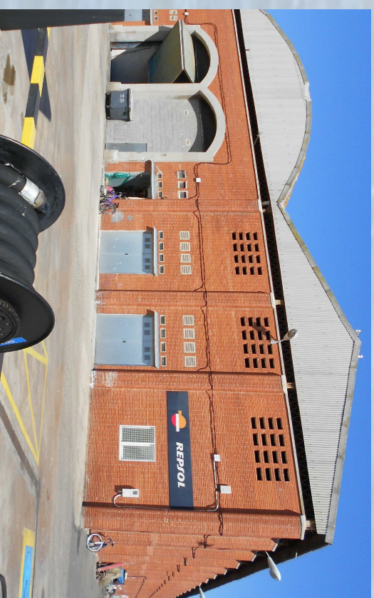
1. Magatzem de xarxes