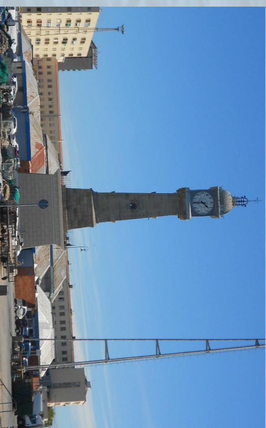
3. Torre del rellotge