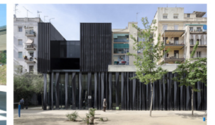
pati d'illa biblioteca Joan Oliver