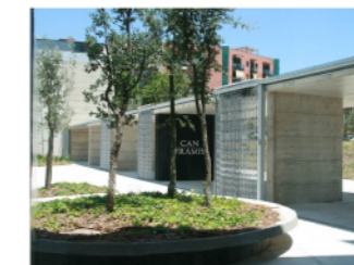
pati de Can Framis

El pati d'accés a l'equipament vol recollir al visitant en un entorn agradable, amb un ritme de façana acollidor i que engloba a l'usuari. Tanmateix, per a fer un tancament de l'espai, s'opta per un tipus de reixa "mòbil" i transparent que permet la visibilitat encara des del pati cap a l'espai públic de carrer.