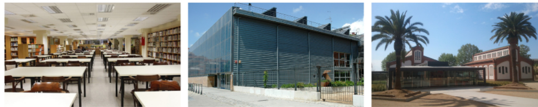
biblioteca Caixa Laietana biblioteca Pompeu Fabra biblioteca Antoni Comas

Ara per ara no hi ha cap servei de residència per acollir a aquests estudiants i/o professors o qualsevol persona relacionada amb la universitat que s'hagi d'allotjar durant un cert temps a Mataró.