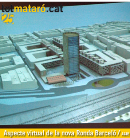
Aspecte virtual de la nova Ronda Barceló / ARRI

El pasatge també es rehabilitarà en el tram de 500 metres, entre el Centre de Mataró Marítim (CNM) i la zona de Sant Joan. El sector al CNM es convertirà en una plaça que disposarà de noves places d'aparcament. Es creuarà el traçat del viari per habilitar una amplada de 6 metres que permeti la circulació en doble sentit al carrer de les cases del Calbó. La platja disposarà d'una nova línia d'espai per protegir la costa dels temporals.