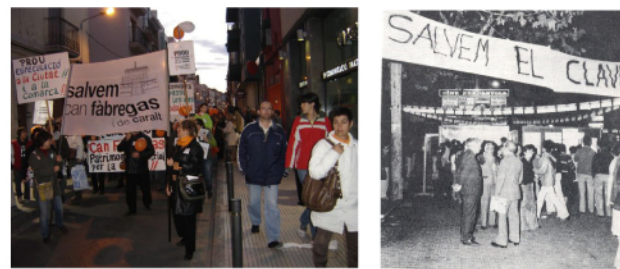
manifestacions a Mataró per salvar edificis històrics de l'enderroc

Dels 51.586 m 2 de sòl afectat, el 70% (35.941 m 2 ) serà públic, davant el 30% de sòl privat (15.645 m 2 ), entre residencial i terciari. Es preveuen 60.020 m 2 de sostre residencial (un màxim de 729 habitatges) i 11.536 m 2 de sostre terciari. El desenvolupament del sector es preveu en un únic polígon d'actuació que, per les grans dimensions dels terrenys, es pot executar en dues o més fases d'urbanització.