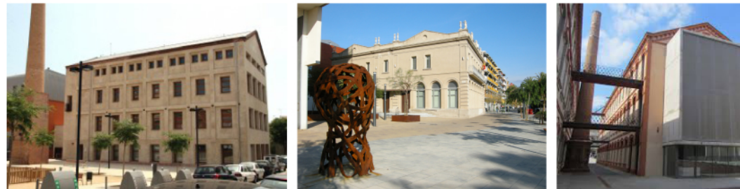
Nau Minguell Cafè de Mar Museu del Tèxtil

Des de fa anys l'ajuntament de Mataró inverteix temps i diners en la rehabilitació i adequació d'edificis industrials i que són patrimoni per a donar-los-hi un nou ús. És el cas per exemple de la Nau Minguell, El Cafè de Mar, o el nou Museu del Tèxtil.