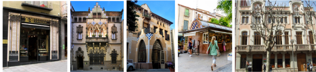
botiga La Confiança casa Coll i Regàs residència St. Josep mercat del Rengle antic Teatre Clavé