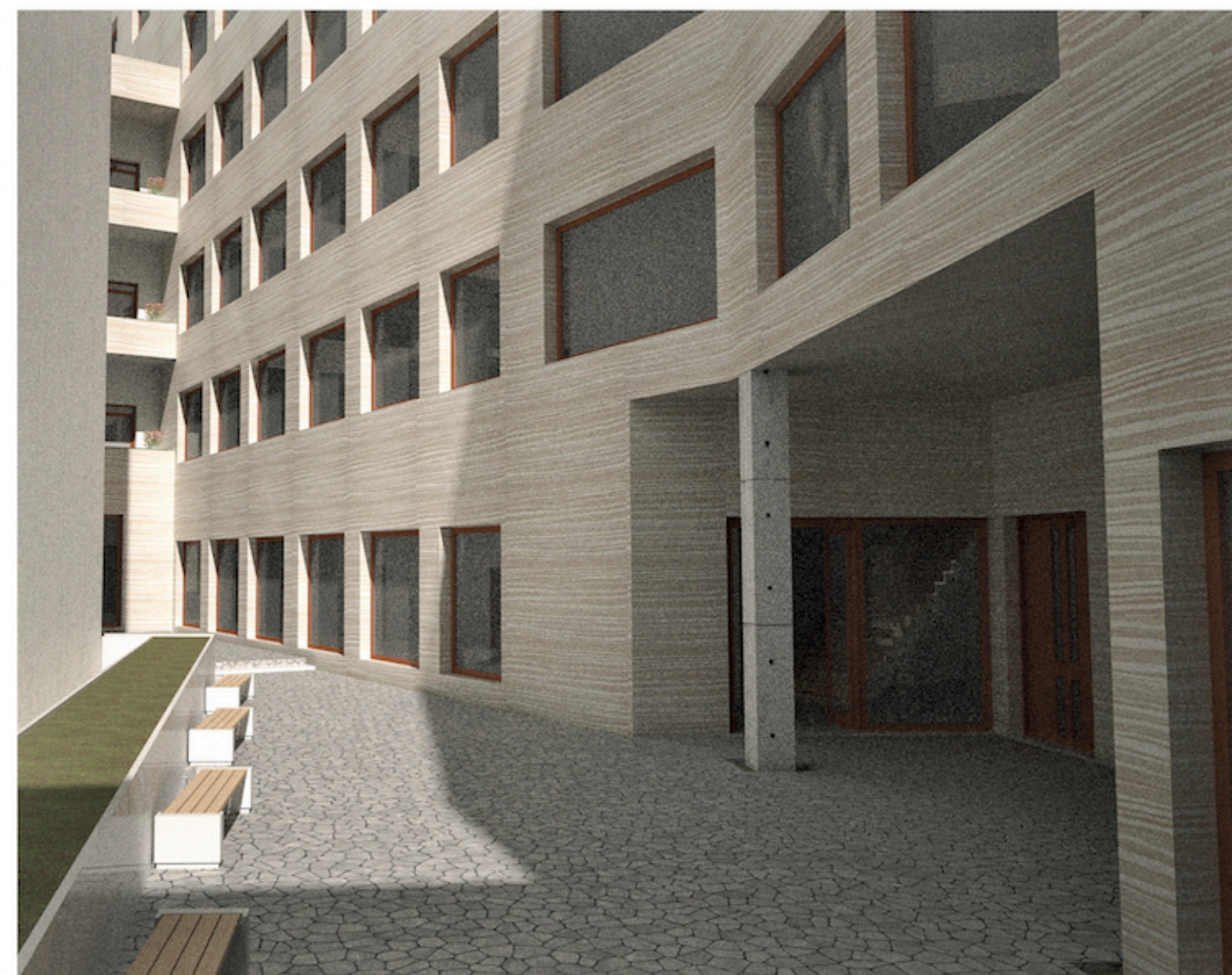
Vista 4 La entrada principal es 'pura sugerencia' en incentivar al viandante a que acceda, además el volumen que genera este efecto es un espacio integrador en si mismo que busca que niños y ancianos compartan sus experiencias.