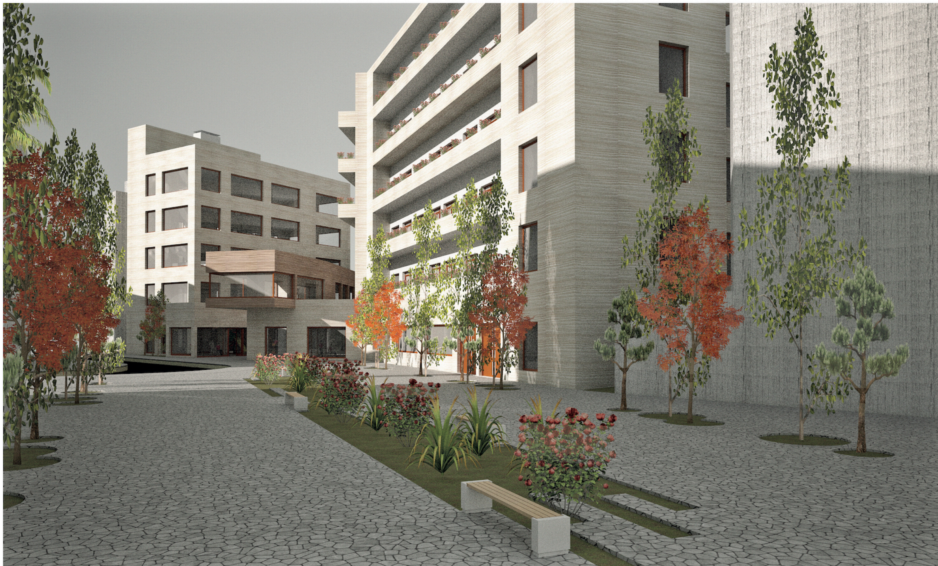
Vista 1 Vista del conjunto en la que se busca esa fluidez espacial urbana y la imagen sostenible de la 'nueva' ciudad