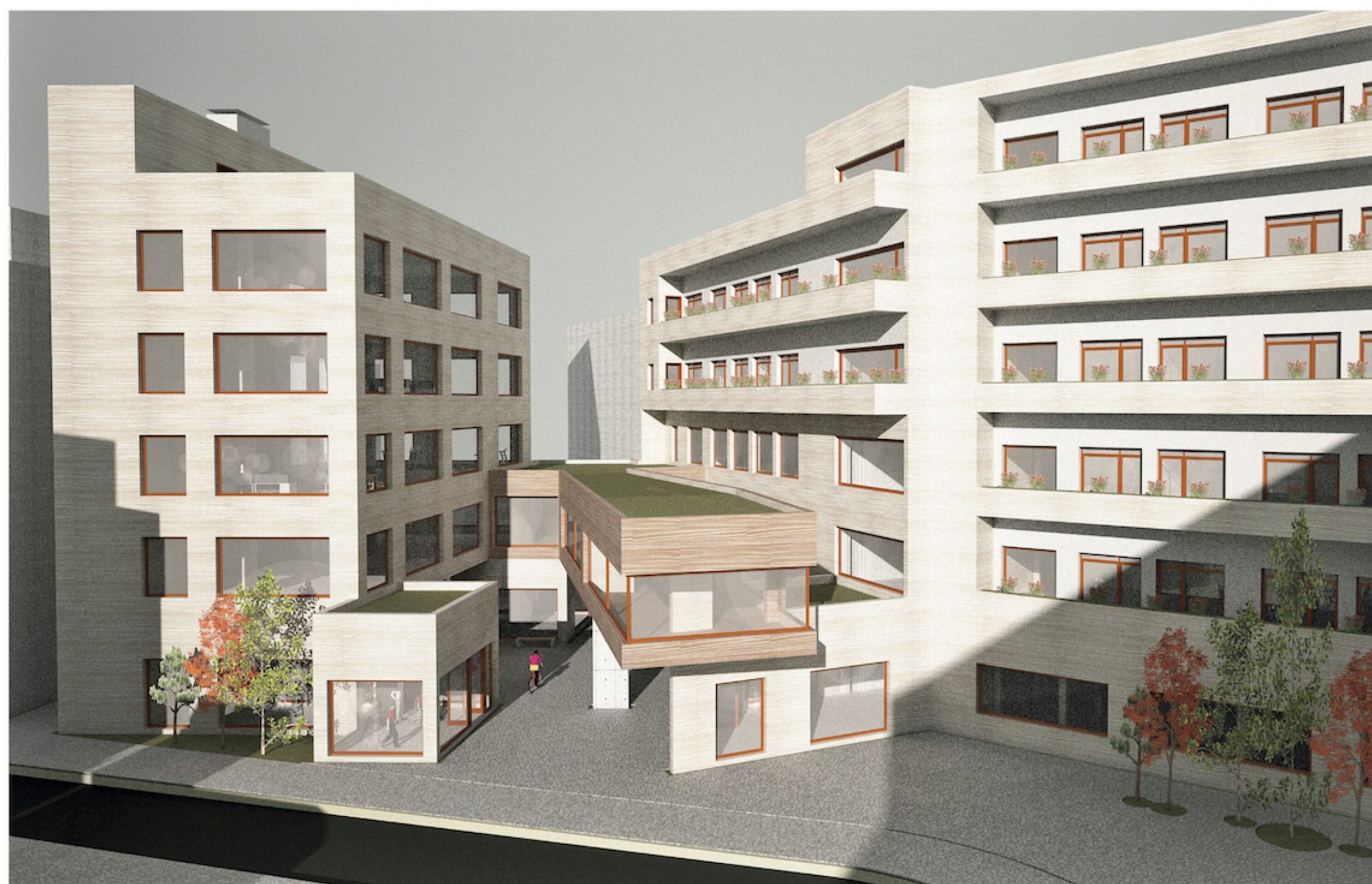
Vista 5 Espacio interior entre medianeras que conecta con otra calle peatonal, es un pequeño espacio de paso y estancia más privado donde los ancianos realizar sus actividades al exterior