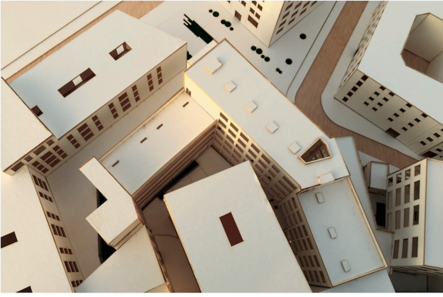
Maqueta del proyecto. Vista superior del conjunto, disposición del patio interior en relación con las volumetrías propuestas