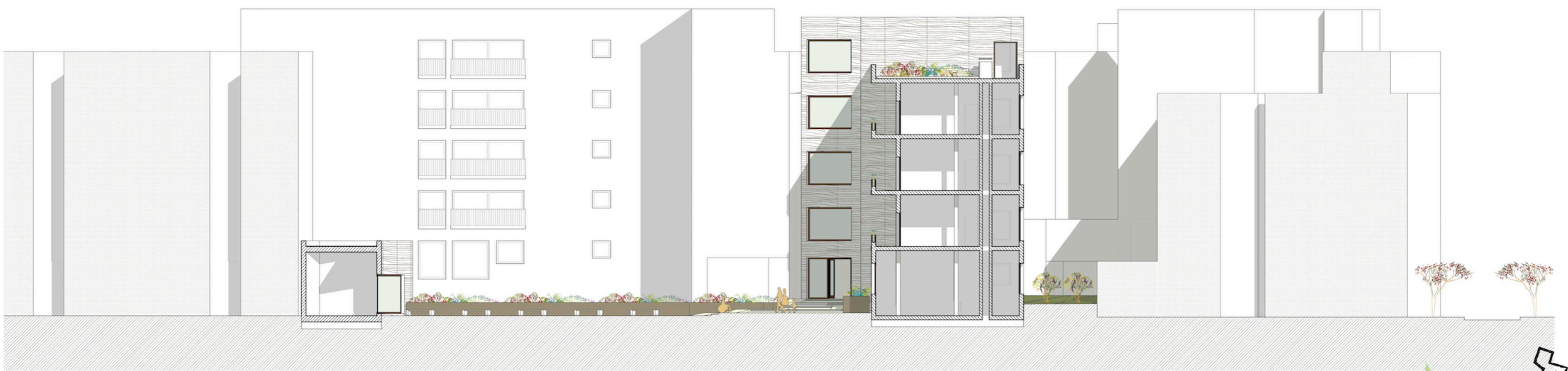
Sección-alzado H-H' del patio interior y su integración en el entorno y fachadas aledañas en la conexión peatonal entre Escala 1:200.