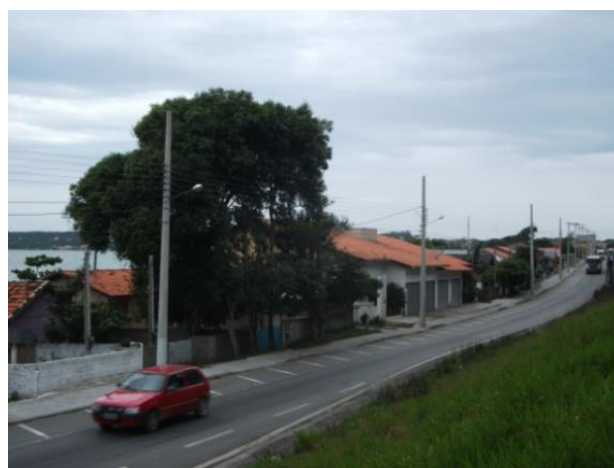
Figura 06: Via marginal, revitalizada ao tráfego de passagem