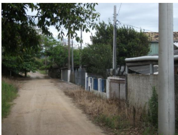
Figura 05: Via marginal, trecho preservado

Outro fator, relevante às intervenções em curso, diz respeito à construção de calçadas para pedestres, anteriormente deficitárias ou inexistentes, levando o pedestre a circular pelo acostamento da rodovia e na via marginal disputar o espaço com os veículos.