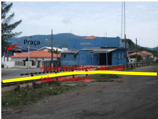
Figura 07: A Estação e a Via para passagem de Nível

futura passagem de nível sob a via elevada na cabeceira da ponte estaiada, junto à antiga estação ferroviária, local que podemos ver nas imagens a seguir: