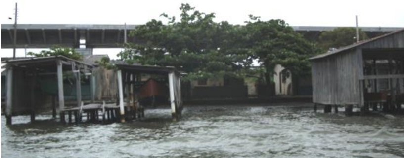
Figura 13: As casas de pescadores e os abrigos de embarcações Fonte: Foto do autor- Nov./2014

Um elemento marcante na comunidade constituí-se na prática da pesca artesanal. A imagem a seguir ilustra esta condição.