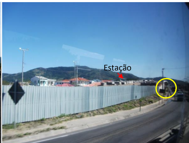
Figura 08: O vão sob a via, promessa de conexão