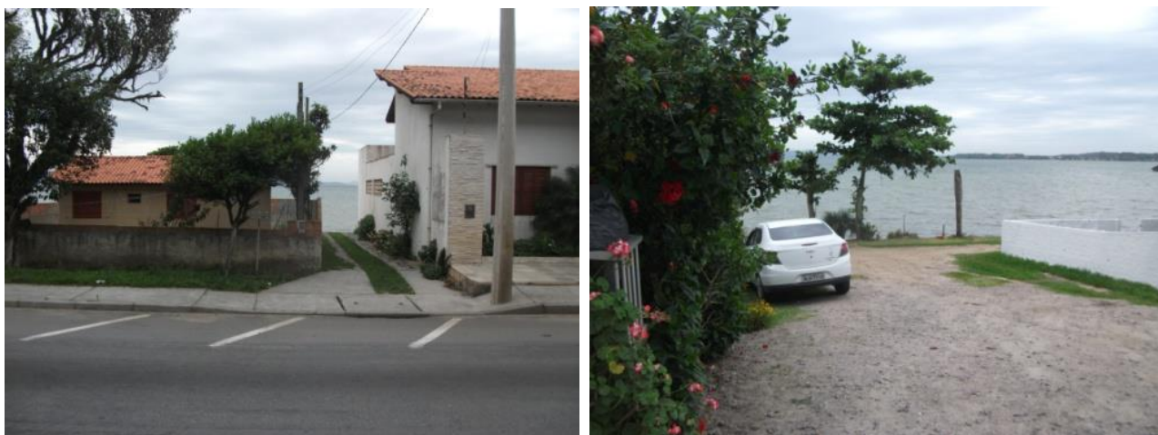
Figuras 09 e 10: Acessos à orla em melhores condições

A disponibilidade de acessos à orla é algo bastante relevante neste estudo, no que diz respeito às condições de fluxo, rompimento de barreiras e rupturas.