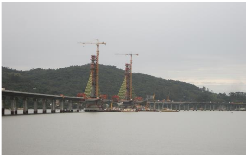
Figura 03: A ponte e os vãos estaiados em construção

Entre as obras executadas sobre o Canal de Laranjeiras, destacamos a ponte estaiada em fase final de execução, resultante da duplicação em andamento do trecho Sul da BR- 101, a qual caracteriza-se como a primeira do Brasil com traçado em curva, ocupando a segunda posição em extensão, sendo superada pela ponte estaiada sobre o Rio Negro no Estado do Amazonas.