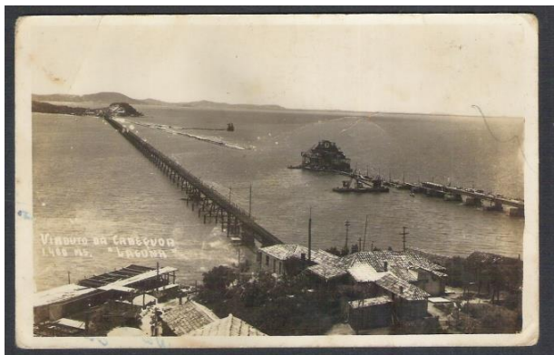
Figura 01: A ponte metálica, o aterro e a ponte de concreto

Avançando o século XX, o rodoviarismo desponta pela difusão do veículo automotor para o transporte de cargas e passageiros, sendo construída juntamente com o aterro, a partir de 1934, a ponte de concreto denominada Henrique Lage, permitindo o tráfego rodoferroviário e desativando a ponte metálica, momento que pode ser observado na figura 01, a seguir: