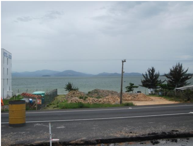
Figura 11: O espaço destinado à praça Fonte: Foto do autor- Nov./2014)