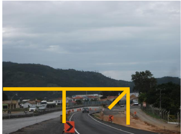
Figura 12: Leito central e via marginal, local da passarela Fonte: Foto do autor- Nov./2014 -Simulação da Passarela)

Em todo este processo de implantação de infraestrutura urbana, um fato que devemos observar é que a via em construção representa o processo de modernização de um equipamento pré-existente e que se constituiu em elemento gerador da densidade urbana, diferenciando-se de um elemento intruso que altera a condição anterior, gerando maiores fluxos, porém acompanhados de melhorias urbanas. Com efeito, as obras complementares à duplicação da BR-101 inserem a condição de que “a via se transforma e permite a diversificação e multiplicação das funções distributivas de um complexo substrato de funções de distribuição rápida de pessoas, alimentos, água, gás e remoção do lixo” (Panerai, 2013:11).