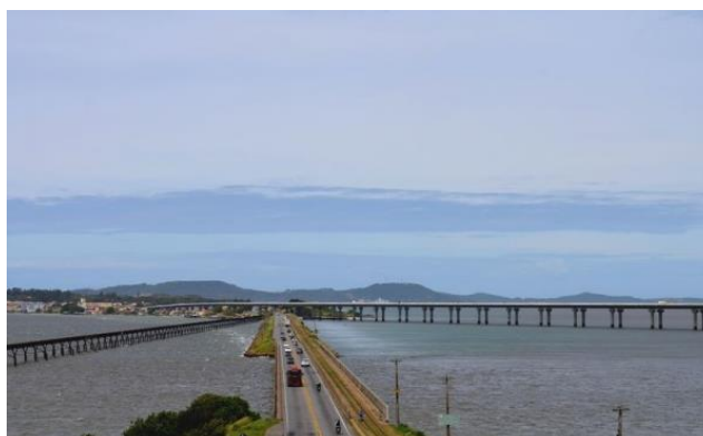
Figura 02: As três obras de arte no Canal de Laranjeiras