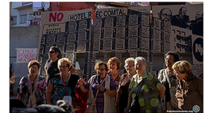
Fig 5, 6 i 7. Des del 1999 l'Associació de veïns del Casc Antic treballa per aturar la construcció de l'hotel. S'han organitzat assemblees informatives, protestes, distribució de pancartes...