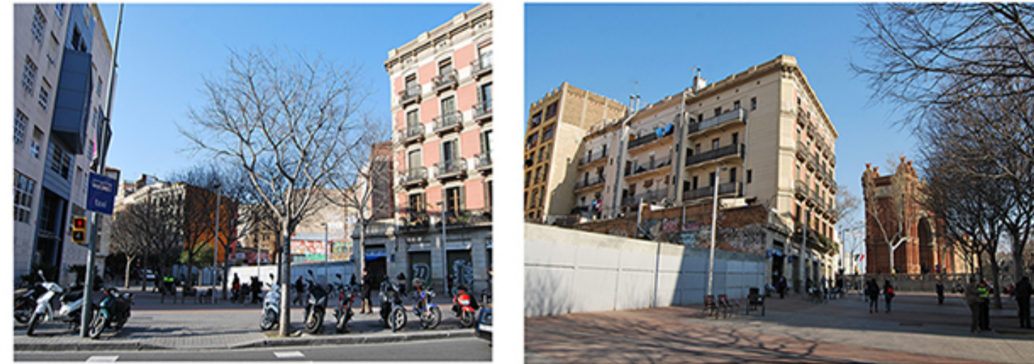
2 Porta d'accés al Casc Antic. C/ Rec Comtal des del Passeig Lluís Companys 3 Vista de l'Arc de Triomf i del Passeig Lluís Companys des del C/ Rec Comtal.