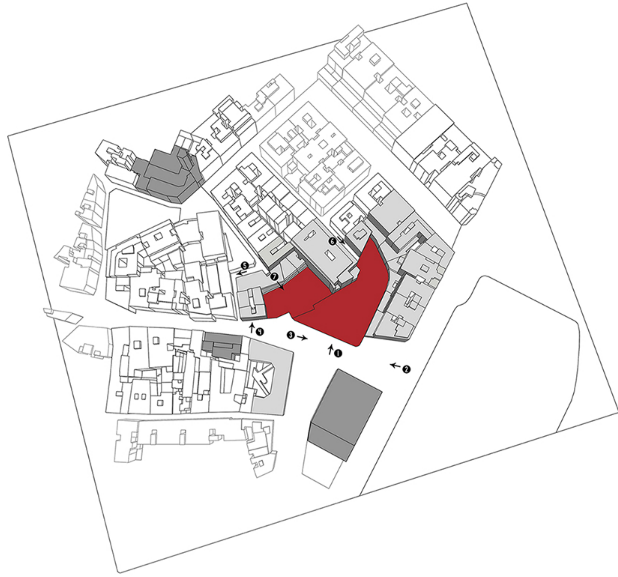
Perspectiva del solar i la seva "no-relació" amb l'entorn