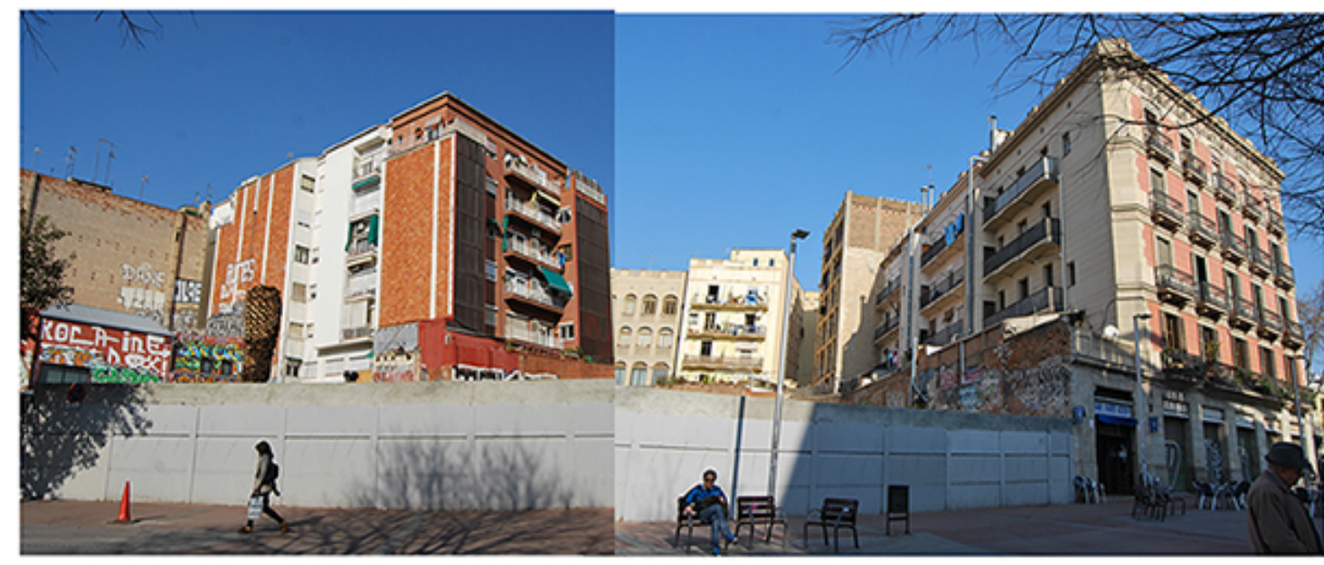
1 Solar en desús. Conjunt d'habitatges que configuren els límits d'interior d'illa amb mitgeres i façanes posteriors. C/ del Rec Comtal, 13-19