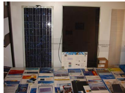
Fig. 6: CISol – Exposición y Información

En clases regulares y optativas de la ETSAV el CISol introduce estudiantes en el diseño solar y las tecnologías solares, como en la eficiencia energética de edificios, desde conceptos bioclimáticos hasta la arquitectura solar "high tech".