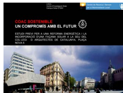
Fig. 5: CISol - Estudio Fachada Solar

En el campo de la industria, el CISol ha comenzado la colaboración con diferentes empresas en el desarrollo de nuevos sistemas solares, con un claro enfoque en la integración arquitectónica de nuevos productos y tecnologías.