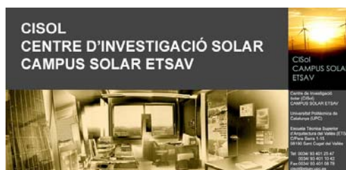
Fig. 3: CISol – Centro de Investigación Solar ETSAV

Como centro de información, exposición y documentación de productos, sistemas y proyectos del ámbito de la arquitectura sostenible con énfasis en sistemas solares CISol ofrece una base sólida de conocimiento sobre la integración arquitectónica de tecnologías solares.