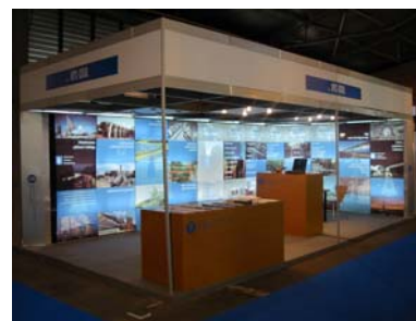
Fig. 4: CISol y CRAL, Municipalia 2002

El área de trabajo se centra en la arquitectura solar, el urbanismo solar, sistemas solares térmicos y fotovoltaicos, el almacenamiento energético, la eficiencia energética y la investigación aplicada, ofreciendo servicios en los campos de la consultoria energética, la formación tecnológica y el diseño solar.