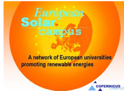
Fig. 7: Proyecto European Solar Campus

A nivel internacional el CISol forma parte del grupo inicial para poner en marcha el EUROPEAN SOLAR CAMPUS 4 , un proyecto desarrollado por COPERNICUS, la asociación de universidades europeas, con el fin de crear una red de campus europeos, comprometidos con la aplicación de energías renovables en sus edificios y la introducción de aspectos de sostenibilidad en sus planes de estudios.