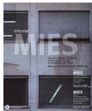
Fig.1:Informe MIES, ETSAV, 1999

El llamado “Informe MIES” 2 , un estudio sobre el impacto medioambiental del Campus de la Escuela Técnica Superior de Arquitectura del Vallès, mostraba que el consumo energético del propio edificio, aunque alto en comparación con otros edificios, es relativamente bajo en comparación con el consumo causado por la movilidad de sus estudiantes.