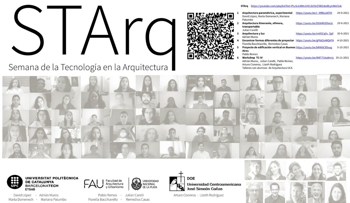
Fig. 3 Afiche Workshop STARq.

Por otra parte, haciendo una comparación entre los resultados de la experiencia docente presencial y la experiencia docente en línea, se observa que no hay diferencia significativa, lo cual, tiene dos connotaciones; una es que la metodología ABP se desarrolla exitosamente con independencia del modelo de enseñanza y la otra es que los instrumentos de las TIC se adaptan muy bien al desarrollo de anteproyectos técnicos arquitectónicos, por ejemplo, el trabajo en archivos colaborativos y de sincronización en tiempo real, también la sistematización del proceso evolutivo del proyecto en la nube, así como las pizarras virtuales, entre algunos.