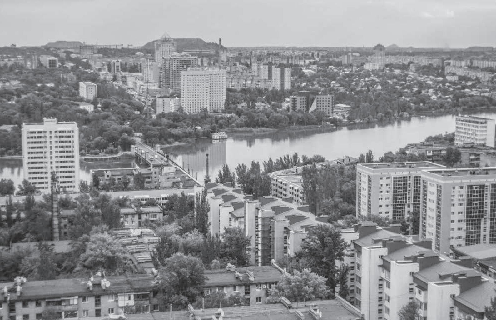
Vista de la ciutat ucraïnesa de Donetsk.

El Govern rus el va contractar per tal de blindar la fortalesa militar de Kronstadt —illa situada molt a prop de Sant Petersburg i seu de la principal base de la flota russa al Bàltic—. I així va començar la seva relació amb Rússia, si bé no va ser ferma fins al 1856, després de la Guerra de Crimea, quan l'Imperi decidí impulsar la indústria pesant i la xarxa de ferrocarrils del país per tal de garantir el seu desenvolupament econòmic i la modernització. Es cridà llavors experts estrangers que poguessin aportar coneixement tècnic i experiència; entre ells, John Hughes.