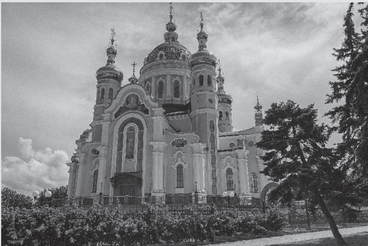
Catedral ortodoxa de Donetsk.

Hughes, mentre anava instruint ucraïnesos i russos, va necessitar inicialment treballadors ja formats per als alts forns i les mines, enginyers, operaris... Molts eren gal·lesos que es van traslladar a Ucraïna amb les seves famílies, atrets per les bones condicions econòmiques, per bé que el clima era molt més dur, amb temperatures extremes.