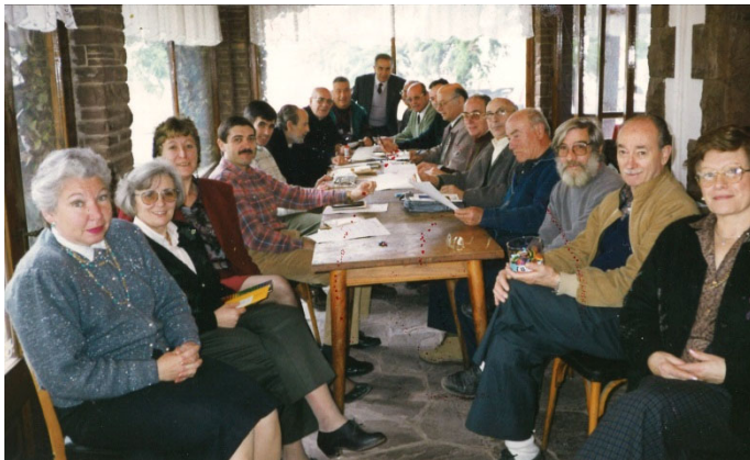
Junta de l'associació Amics Aplec de Matagalls al restaurant "Les 4 Carreteres" (Tona), 1991.