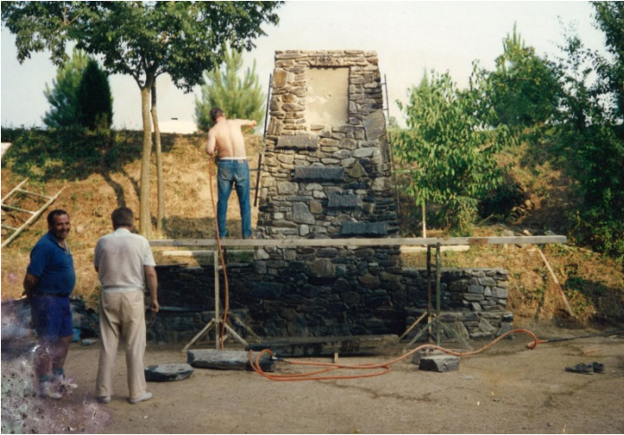
Construcció al 1993 de la font del Remei a l'Arbreda de Palautordera.