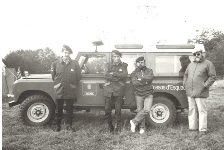
Els Mossos d'Esquadra a l'acampada del 35è. Aplec.