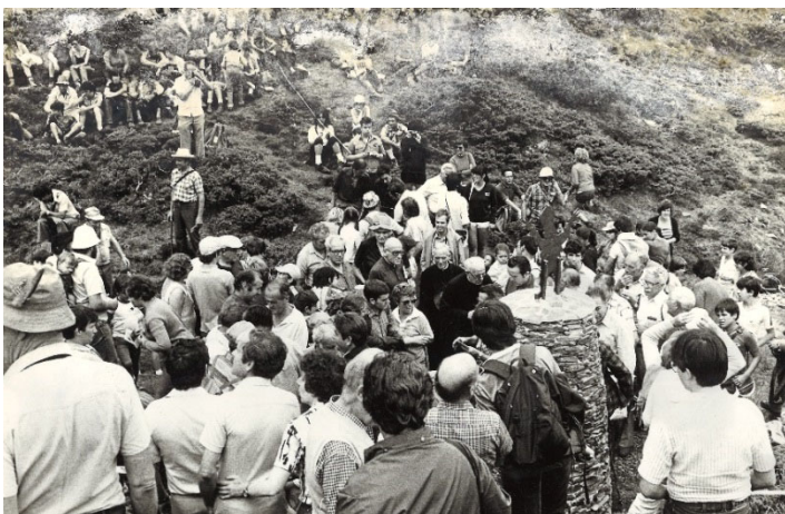
Benedicció font dels Cims, 1981.