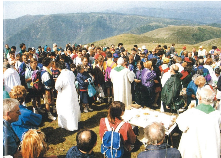
Celebració de la missa del 46è. Aplec, una mica més avall de l'altar.