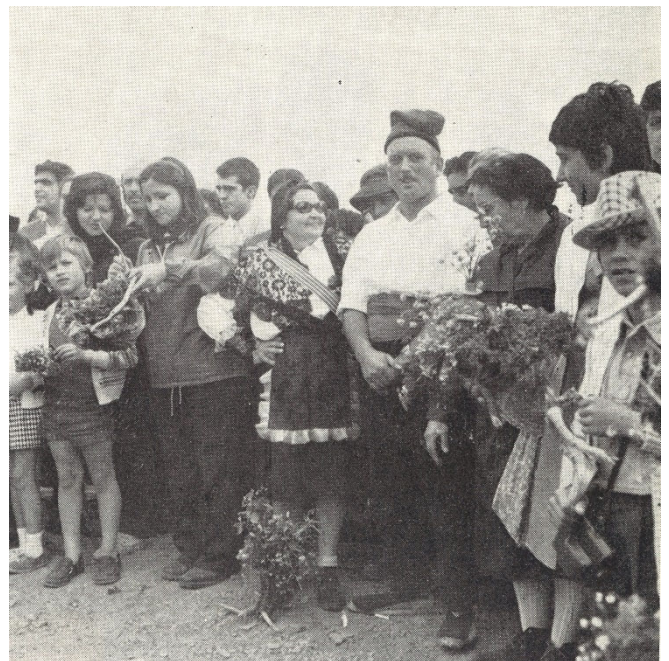
Concurs de rams de flors boscanes al 23è. Aplec.

Pel 23è Aplec (1972) el Centre Excursionista de Catalunya va millorar l'antiga font de Riudeboix, al terme municipal del Brull, a partir d'aleshores dedicada a Artur Osona (autor de la primera guia del Montseny). La font fou beneïda pel provincial dels claretians, pare Ferran Maria Carrera. Tot i el mal temps a Matagalls es va poder celebrar la missa a la Creu, oficiada pel pare Hildebrand Maria Miret (autor de la guia del Canigó). A la portada de l'àlbum destaquen quatre perfils en homenatge al pare Claret, Verdagner, abat Oliba i Artur Osona. Hi ha pàgines claretianes dedicades al sant, planes verdaguerianes explicant els actes celebrats pel centenari, i articles que parlen del gran excursionista Artur Osona (Josep Iglésias).