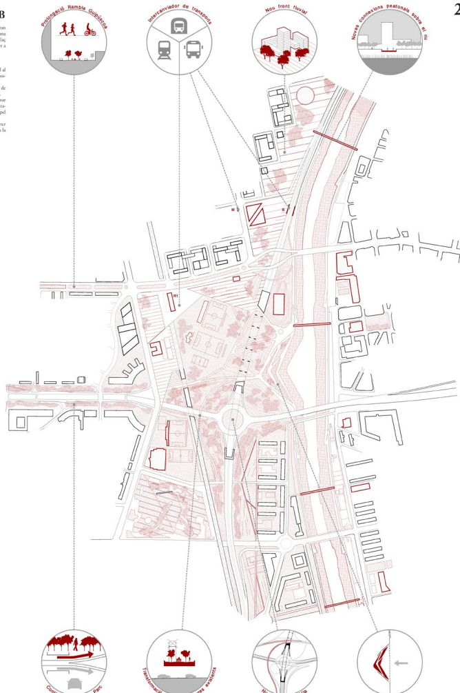
Nou Parc Gran Via Besòs, planta E 1:8000