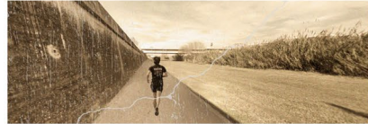
2020_Parc Fluvial 2030_Plaça Fluvial