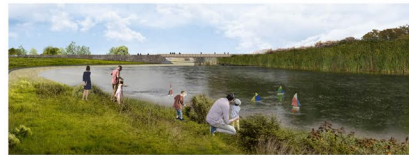
2020_Parc Fluvial 2030_Plaça Fluvial