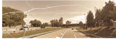
2020_Gran Via 2030_Parc Gran Via Besòs

La creació d'una infraestructura exclusiva per a la circulació de serveis de transport públic per carretera (BRT) en les calçades de la Ronda Litoral. L'execució d'una nova parada de la línia ferroviària R1 per tal de conformar un nou itinerari de transport públic en el barri de la Besòs, juntament amb el servei de metro i amb els futurs serveis d'autobús express pel BRT de la B-10. Aquesta parada, situada en un punt estratègic a l'antiga trinxera del carrer Pau IV, davant del nou parc de Gran Via Besòs, permetrà a més a més la continuïtat de l'equip públic per sobre de les vies del tren.