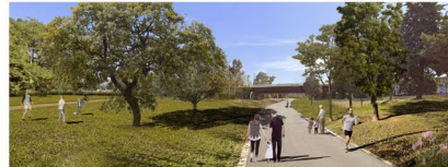
2020_Parc Fluvial 2030_Plaça Fluvial