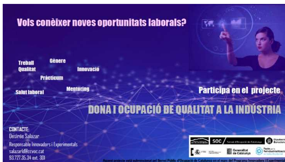
Figura 1- Cartell de difusió projecte