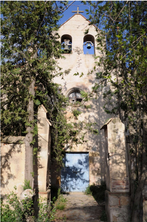
Ermита de Santa Magdalena