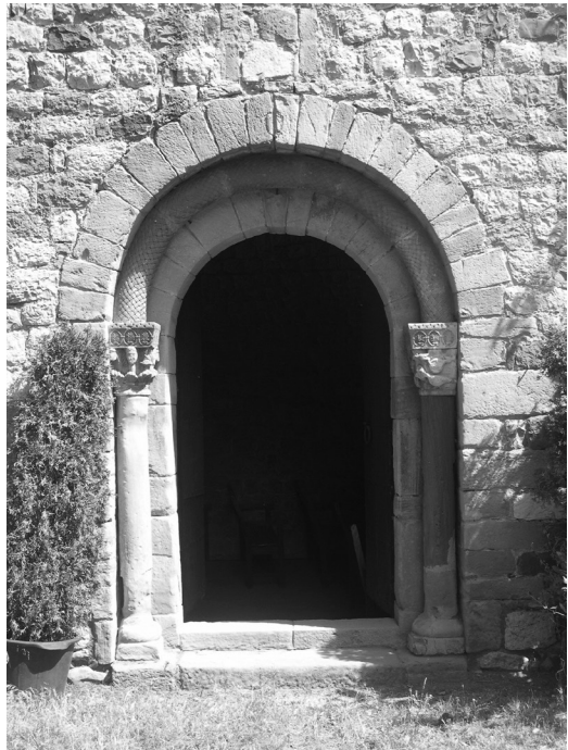
Portalada de Santa Maria del Camí. Fotografia: Pere Cornellas, 2003.

Situada a l'entrada sud de la Garriga, sobre el camí Ral, Santa Maria té l'apel·latiu del Camí precisament per aquest important pas, ja que inicialment era una petita cel·la monàstica i en el segle XIII va ser hospital de camí atès per deodades. L'ermita sembla gaudir de l'amplitud del lloc, amb camps conreats a llevant, l'ombregat bosc de Malhivern a nord-est, i el parc on les famílies s'ajunten per gaudir d'aquest miratge natural al sud. L'església és de planta rectangular, amb absis quadrat d'orientació est. Els murs són de fàbrica regular, amb carreus treballats als angles. La nau és de volta apuntada, amb un desnivell respecte a l'absis que dona lloc a l'arc triomfal. Manté la portalada original romànica amb obertura al sud, amb un arc de mig punt amb arquivolta emmarcada per dovelles a dos nivells, una de les portalades més belles del romànic montsenyenc. 40 A l'interior conserva la làpida sepulcral de Quixilona, 41 germana petita de l'abadessa Emma. Hi ha estudis que afirmen que l'enclavament original visigòtic hauria estat aixecat el 898, vinculat al monestir de Sant Joan de les Abadesses, però l'actual construcció és del segle XII.