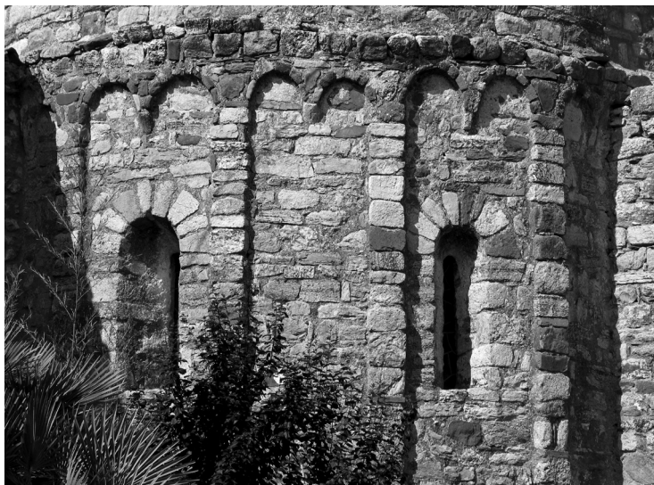
Decoracions llombardes a l'absis de Sant Andreu de Samalús. Fotografia: Pere Cornellas, 2004.

Ponències Revista del Centre d'Estudis de Granollers, 25 (2021), 169-202