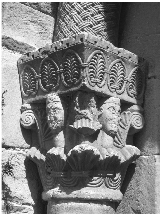
Detall del capitell de Santa Maria del Camí.

Ponències Revista del Centre d'Estudis de Granollers, 25 (2021), 169-202