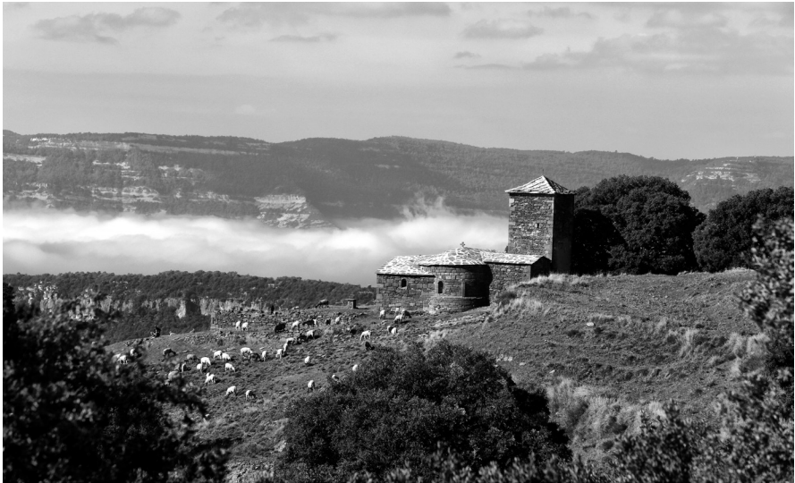
Imatge 15. Sant Cebrià de la Móra, amb un emplaçament dominant sobre la vall de l'Avencó, afluent del Congost.

La Móra és un topònim que apareix l'any 898 fent referència al veïnat d'unes poques cases disperses situat al vessant nord-oest de la Calma, al límit septentrional del terme municipal de Tagamanent. Sant Cebrià és un exemple clar del lligam del romànic amb el paisatge, una potent integració de l'arquitectura mil·lenària amb la geografia. Des de l'església podem gaudir de la serra de Picamena i els cingles de Bertí, amb una panoràmica que no ens cansaríem mai de mirar. Església de pedra vermella local, originalment era un temple d'una sola nau coberta amb volta de canó, rematada a llevant per un absis semicircular de volta de quart d'esfera. Va ser ampliada posteriorment per afegir-hi dues capelles laterals, la sagristia i el campanar, i va perdre la porta original orientada a migdia. L'absis denota dues etapes constructives clarament diferents: una primera faixa llombarda més gruixuda, i una de superior amb finestra d'arc de mig punt monolític. L'església de Sant Cebrià és documentada per primera vegada l'any 1102. 50