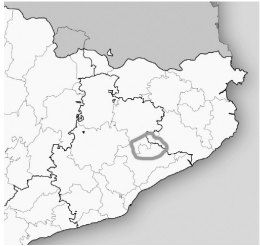
Figura 1. El parc natural del Montseny ubicat en un mapa amb els límits comarcals i provincials de Catalunya.

En aquest article sintetitzem les característiques romàniques i destaquem l'especial implantació a la topografia i el paisatge del lloc de 33 esglésies romàniques d'aquests municipis vallesans (vegeu la taula de l'apèndix). Es pot veure l'emplaçament dels temples en l'ortofotomapa amb geolocalitzacions (de consulta electrònica) creat específicament per a aquest article. 5 Un paisatge vallesà del Montseny entès com a patrimoni culte i popular amb vivències que el doten de valor afegit, una imatge pròpia del territori. 6 Es tracta d'un paisatge força estudiat per historiadors i geògrafs, i que té una forta relació amb l'ocupació humana i les transformacions que s'hi produeixen, com a mínim, des d'inicis de l'època romànica. 7