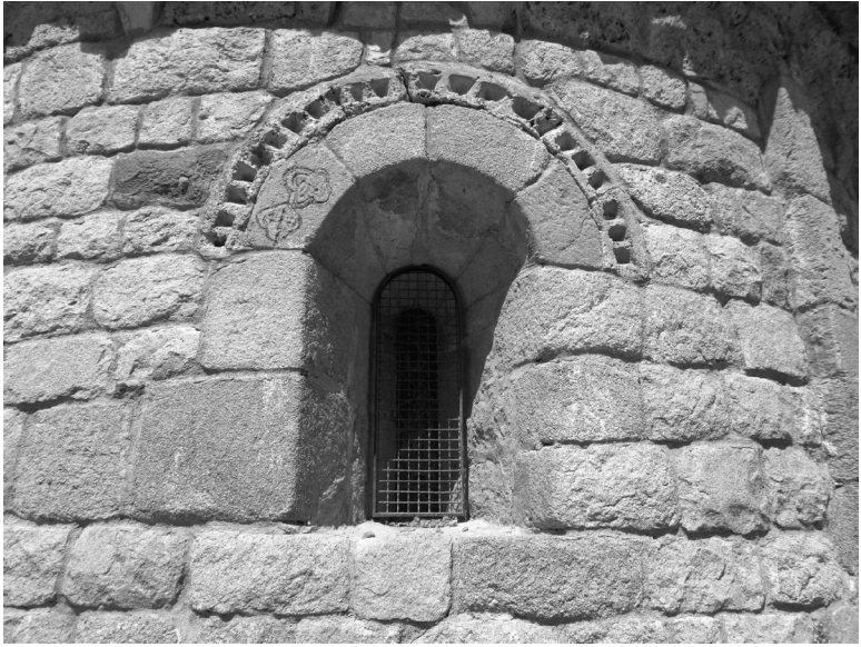
Detall de la finestra esqueixada d'arc de mig punt de l'absis de Sant Vicenç de Gualba, amb decoració de dents de serra i dues figures entrelaçades i desdibuixades a l'arrencada de l'arc. Fotografia: Oscar Farrerons, juny 2019.