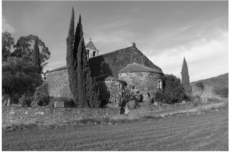
Santa Magdalena des del costat est, en què destaquen dos dels tres absis i la rusticitat de l'aparell dels murs.