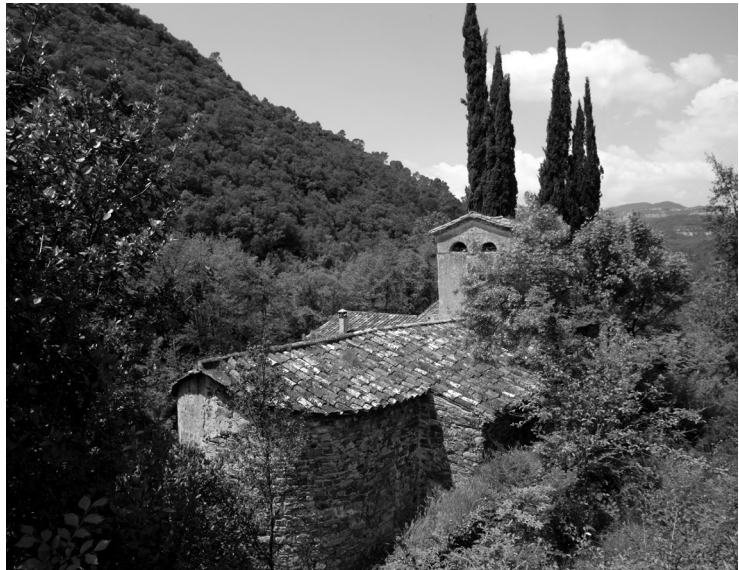
Imatge 12. Sant Pere de Vallcàrquera, on destaca el campanar rectangular i l'absis semicircular. Fotografia: Pere Cornellas, 2004.