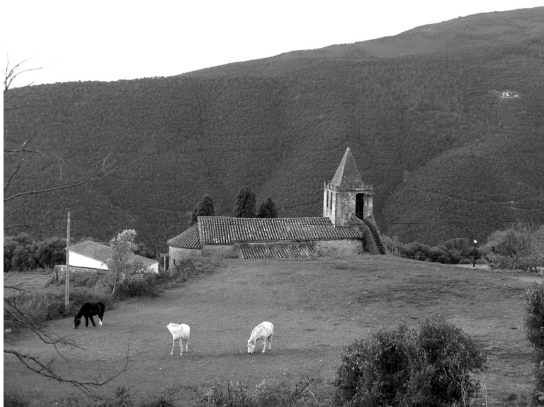
Vista de les cobertes de Sant Esteve de la Costa i de l'accés exterior al campanar. La posició del temple domina el terme de Fogars de Montclús i la seva vessant del Montseny. Fotografia: Pere Cornellas, 2004.

Ponències Revista del Centre d'Estudis de Granollers, 25 (2021), 169-202