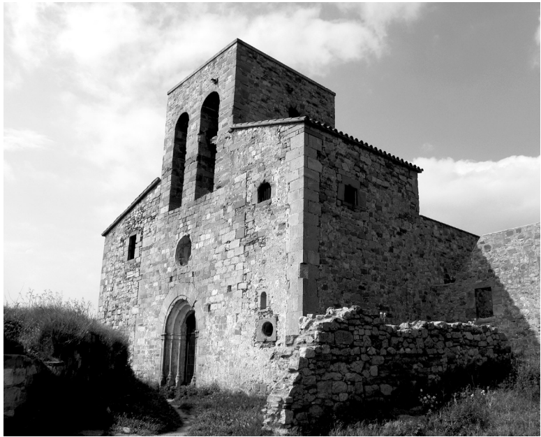
Imatge 13. Santa Maria de Tagamanent, amb la seva posició privilegiada dalt del turó homònim. Fotografia: Pere Cornellas, 2005.

Situada dins del castell de Tagamanent, del qual era capella, és una magnífica mostra de la implantació d'aquest tipus d'arquitectura, al cim del turó homònim. Des de l'església a ponent es domina la vall del Congost i a llevant la part occidental de la Calma. El fet d'estar condicionat pels murs defensius del castell va provocar que l'orientació de l'absis fos al nord-est. Presenta façana principal amb porta adovellada amb dues arquivoltes i columnes cilíndriques de base octogonal. A sobre hi ha un rosetó i el massís campanar de doble forat. La nau central manté la volta de canó seguit d'estil romànic, amb dues naus laterals d'època gòtica. Tot i que Tagamanent és esmentat per primer cop l'any 983 pel comte Borrell, la construcció que podem veure avui és del segle XII. Després del terratrèmol de 1448, l'edifici va haver de ser reconstruït. 48