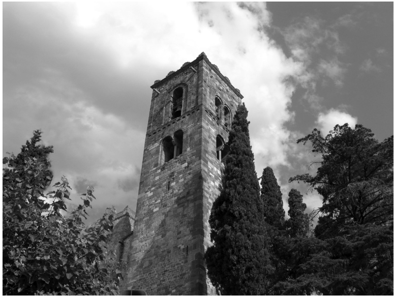
El campanar romànic de Sant Pere de Vilamajor, amb les finestres geminades sostingudes per columnes amb capitell. Fotografia: Pere Cornellas, 2004.