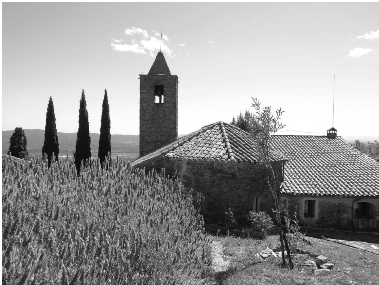
Sant Cristòfol de Fogars i, al fons, la plana vallesana. Hi destaca l'absis i l'esvelt campanar. Fotografia: Oscar Farrerons, maig 2019.