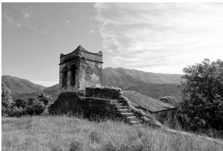
Santa Susanna i el seu campanar. Al fons s'observa el turó de l'Home (1.706 metres) (esquerra) i el puig Sesolles (1.667 metres) (dreta). Fotografia: Pere Cornellas, 2018.

Ponències Revista del Centre d'Estudis de Granollers, 25 (2021), 169-202