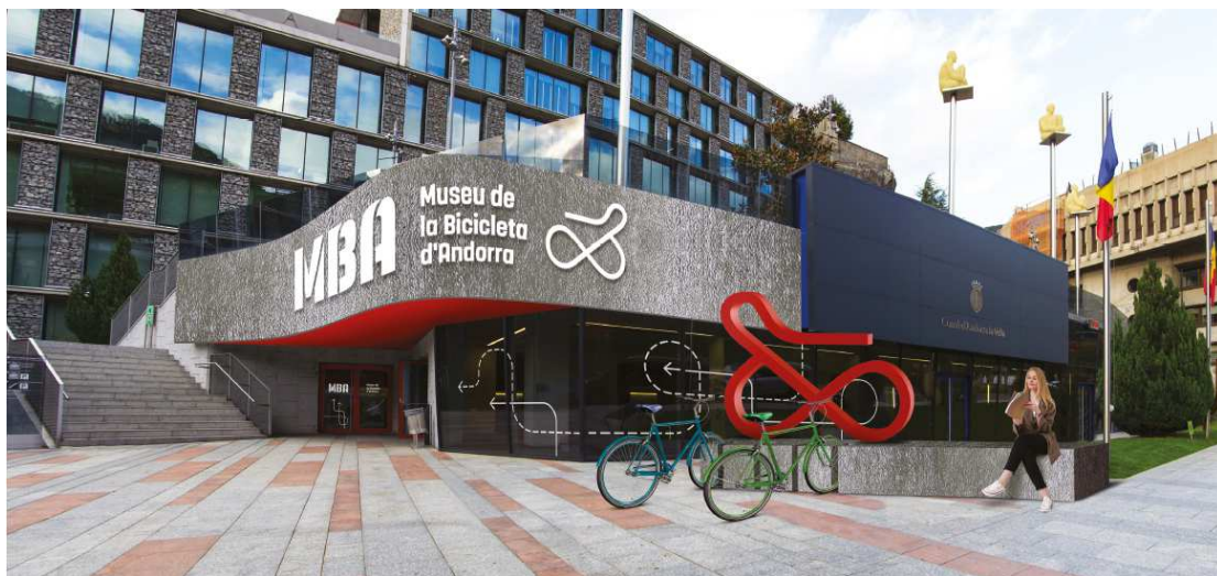
VISTA DEL PRIMER TRAM DE LA BANDA DE MÖBIUS DEDICAT ALS ORÍGENS DE LA BICICLETA