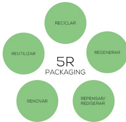
Figura 2. 5R de packaging.