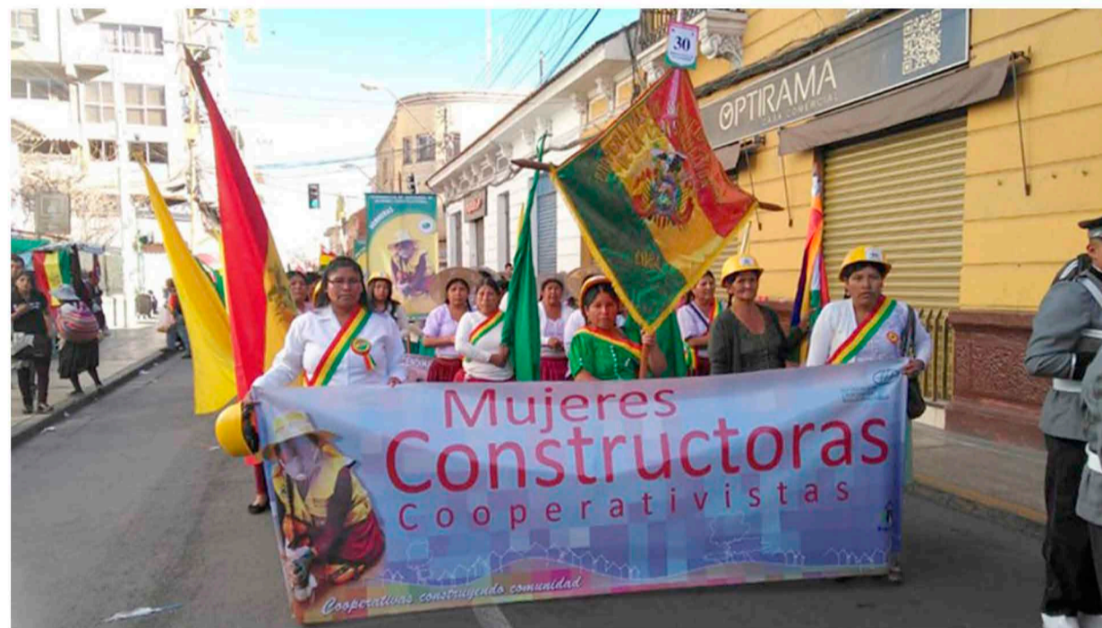
El 6 d'agost del 2019, en commemoració al Día de la Independència de Bolívia, la Central de Cooperatives de Mujeres Constructoras van participar en la desfilada cívica. ("Procasha", 2020)

Donada l'originalitat del projecte i l'ús de tècniques de bioconstrucció, juntament amb la necessitat d'executar i millorar l'estructura de canals de reg de tot el territori, aquest projecte pretén que aquestes cooperatives se'n apoderin per convertir-ho una eina competitiva en el mercat de la construcció.