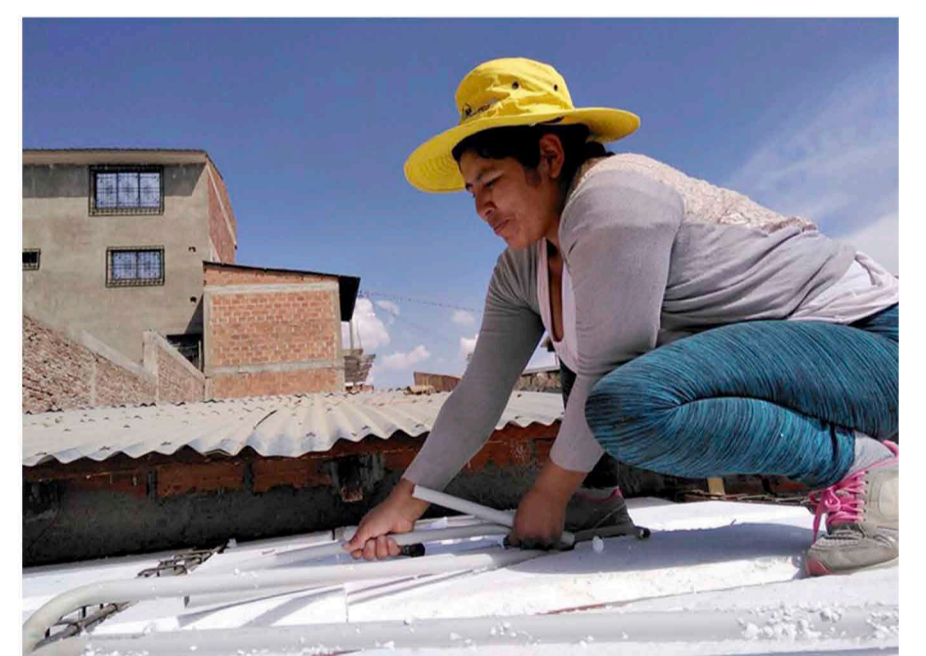
Com a part de les activitats del projecte d'instal·lacions sanitàries a l'assentament la Pampilla, 11 dones constructores, a través de la metodologia "d'aprendre fent" van instal·lar un total de 35 banys secs. ("Procasha", 2020)