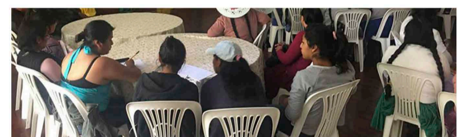
S'organitzen de forma assembleària contínuament per a prendre les decisions de la cooperativa. ("Procasha", 2020)