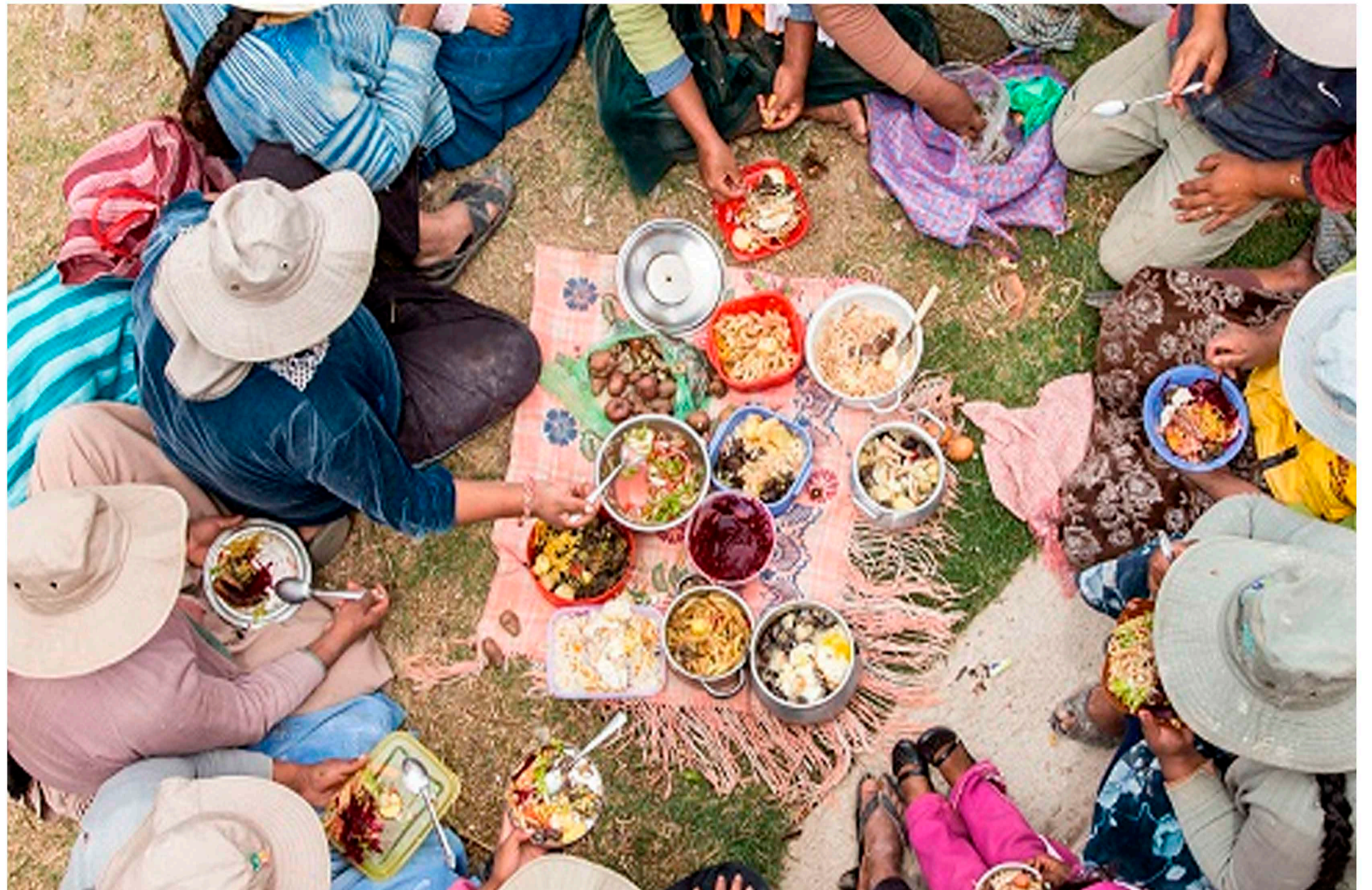
L'empoderament de la figura de la dona no només es realitza en les tasques de la construcció i dignificació de la seva feina sinó a través de la cohesió i els llaços que estableixen entre elles i amb la comunitat on treballen. ("Procasha", 2020)

Situació actual de la dona en el món de la construcció a Cochabamba: