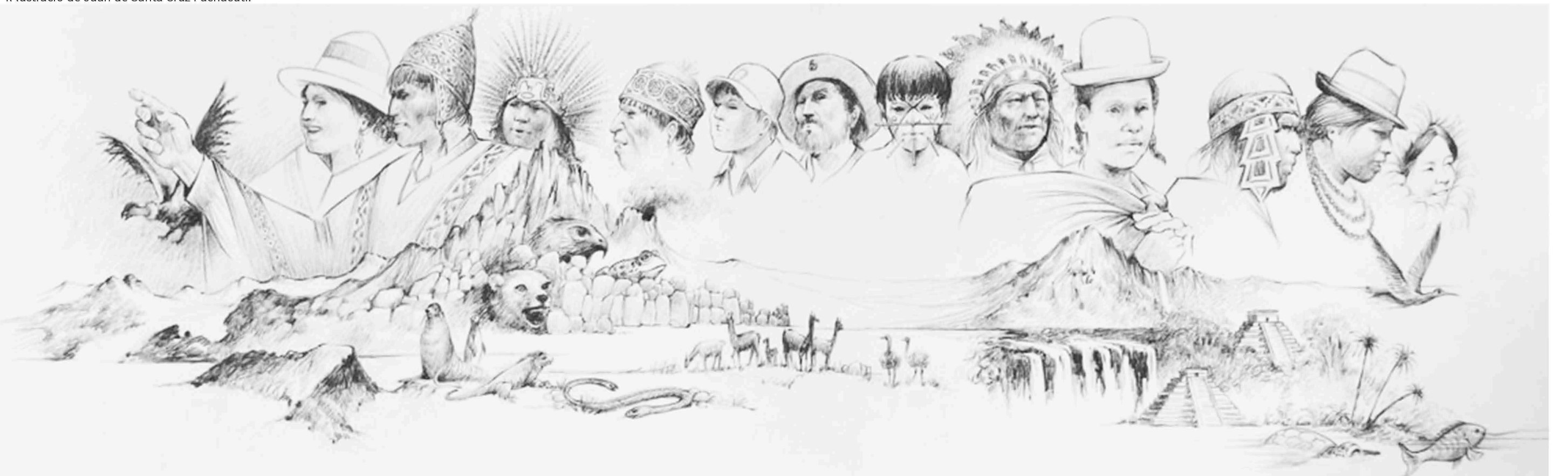
Il·lustració Sumaj Kawsayta Llan'aspa.

“El Vivir bien” és llegir les arrugues dels avis per poder reprendre el camí. Els ancians són respectats i consultats a les comunitats indígenes del país.