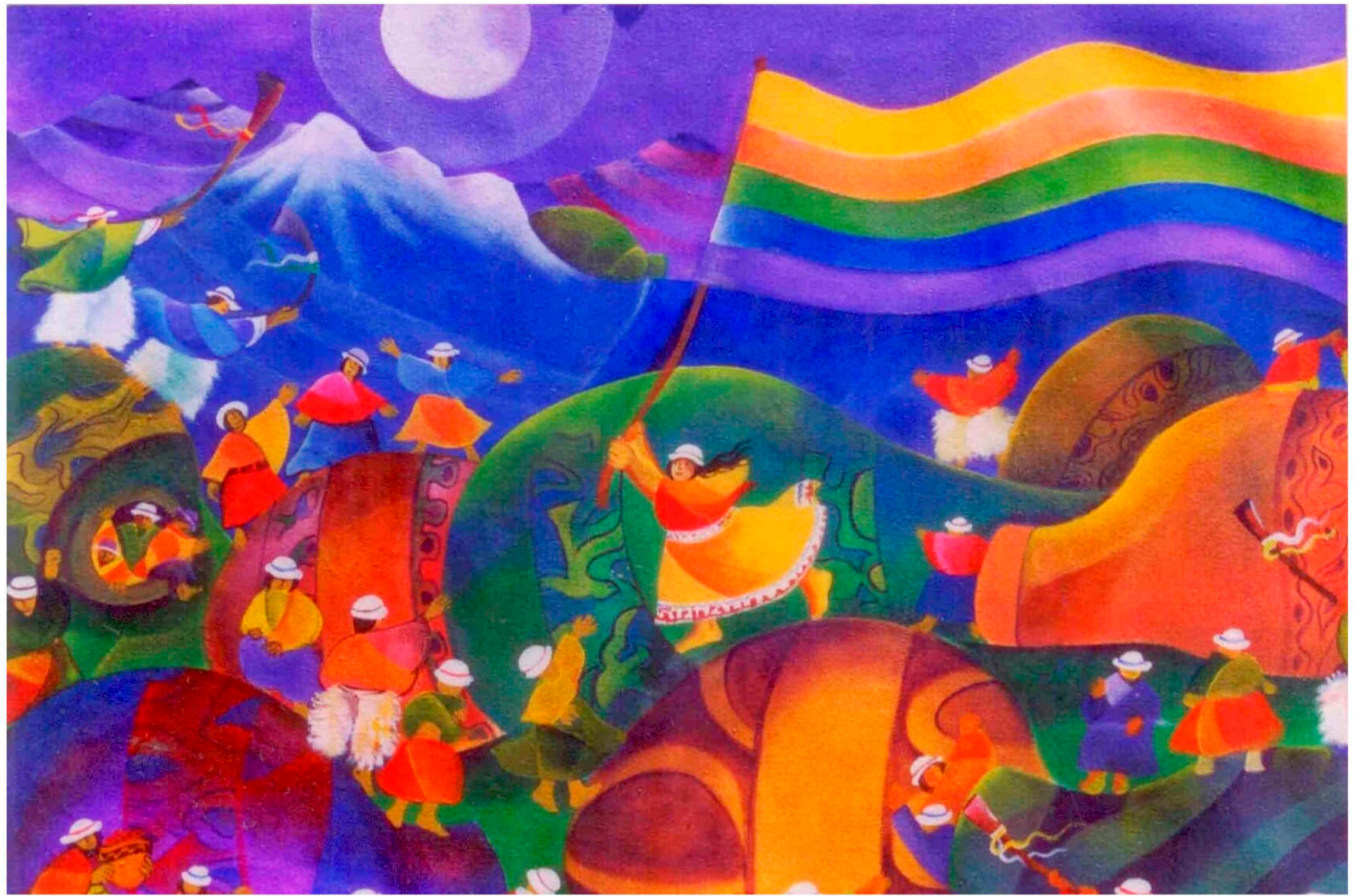
Cròniques de la Tierra sin Mal.