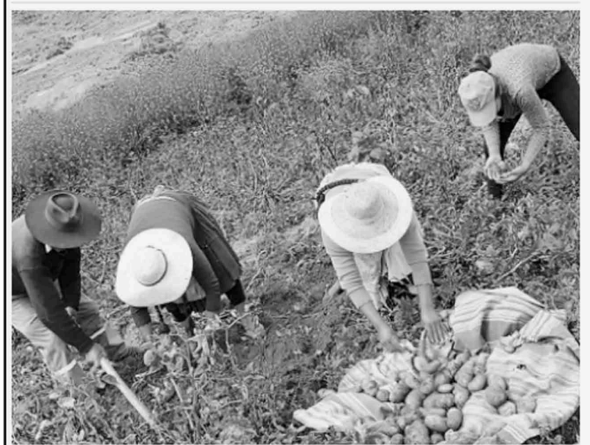
Productores cosechan papa, en la región andina. GOBERNACIÓN DE COCHABAMBA