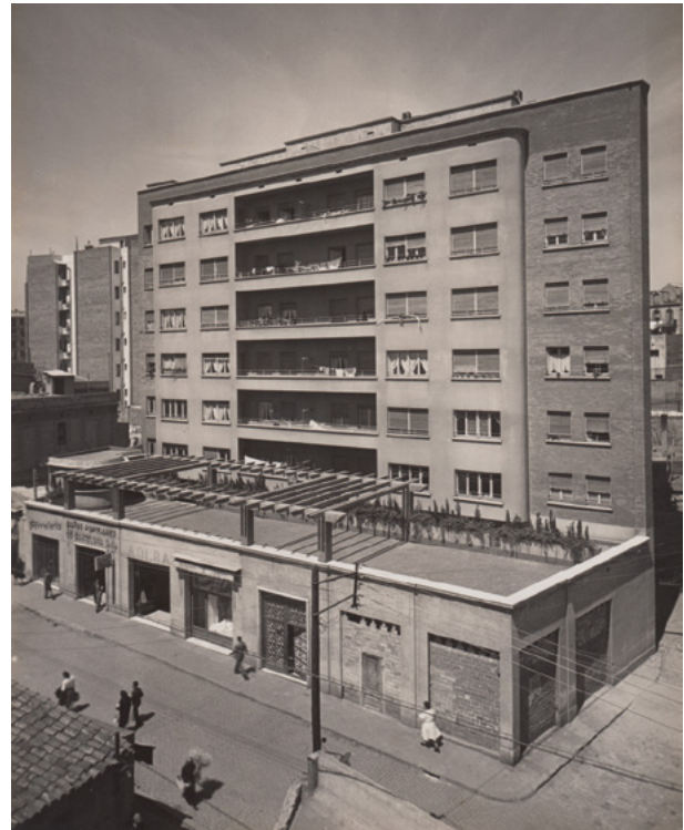
Figures 2 i 3