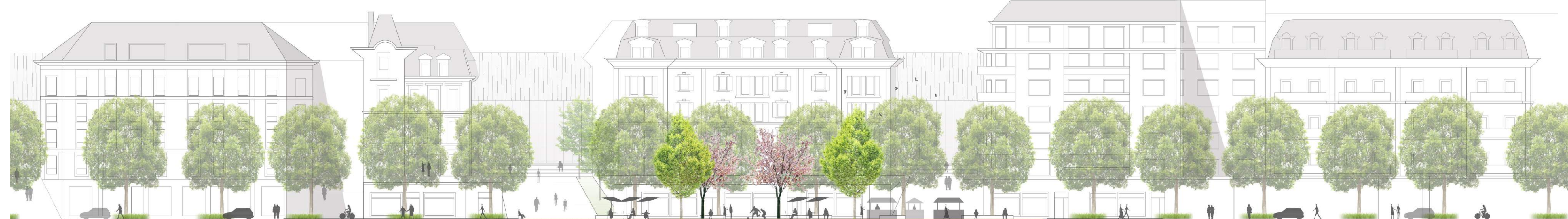
Coupe sur Boulevard de Grancy 1:250