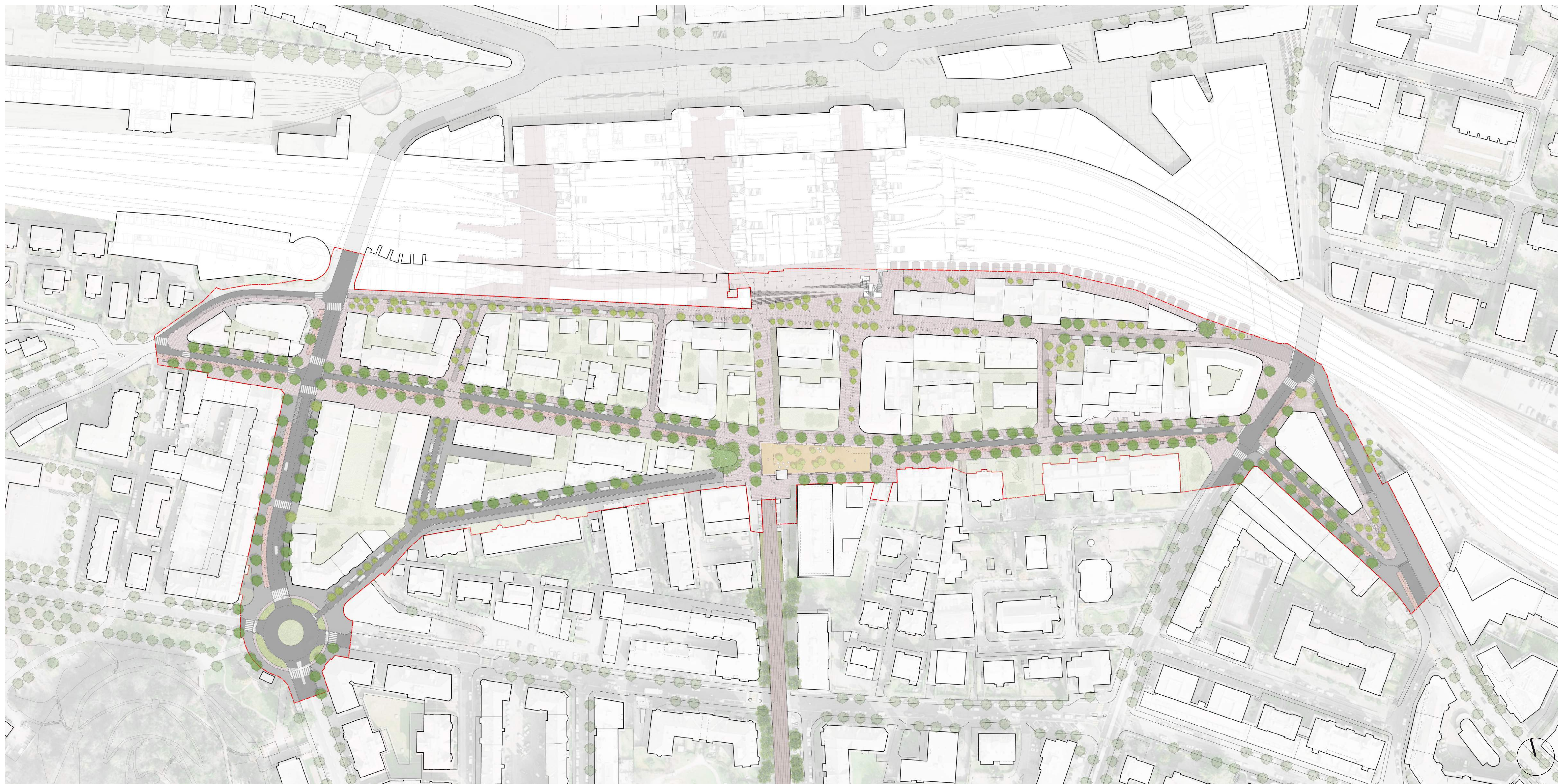
plan du périmètre du concours 1:1000