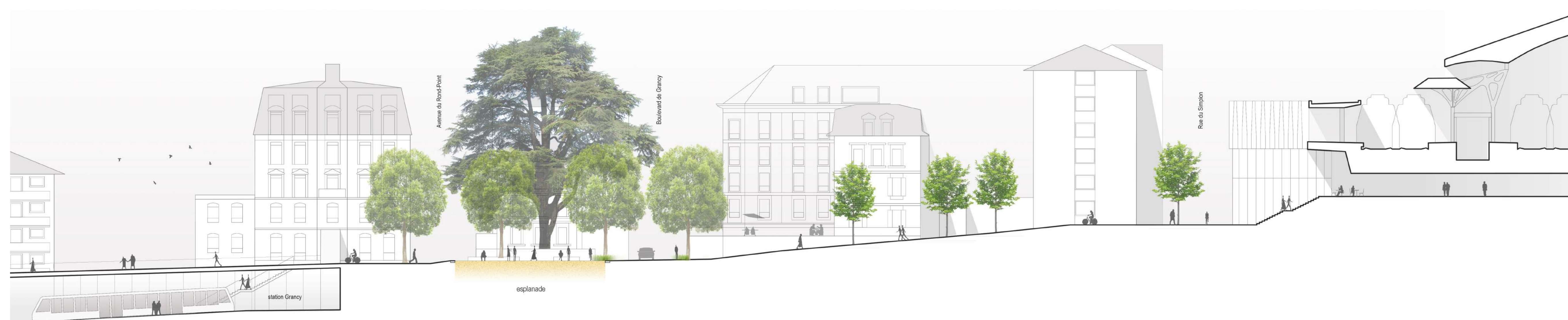
coupe sur l'axe de la Louère Verte 1:250