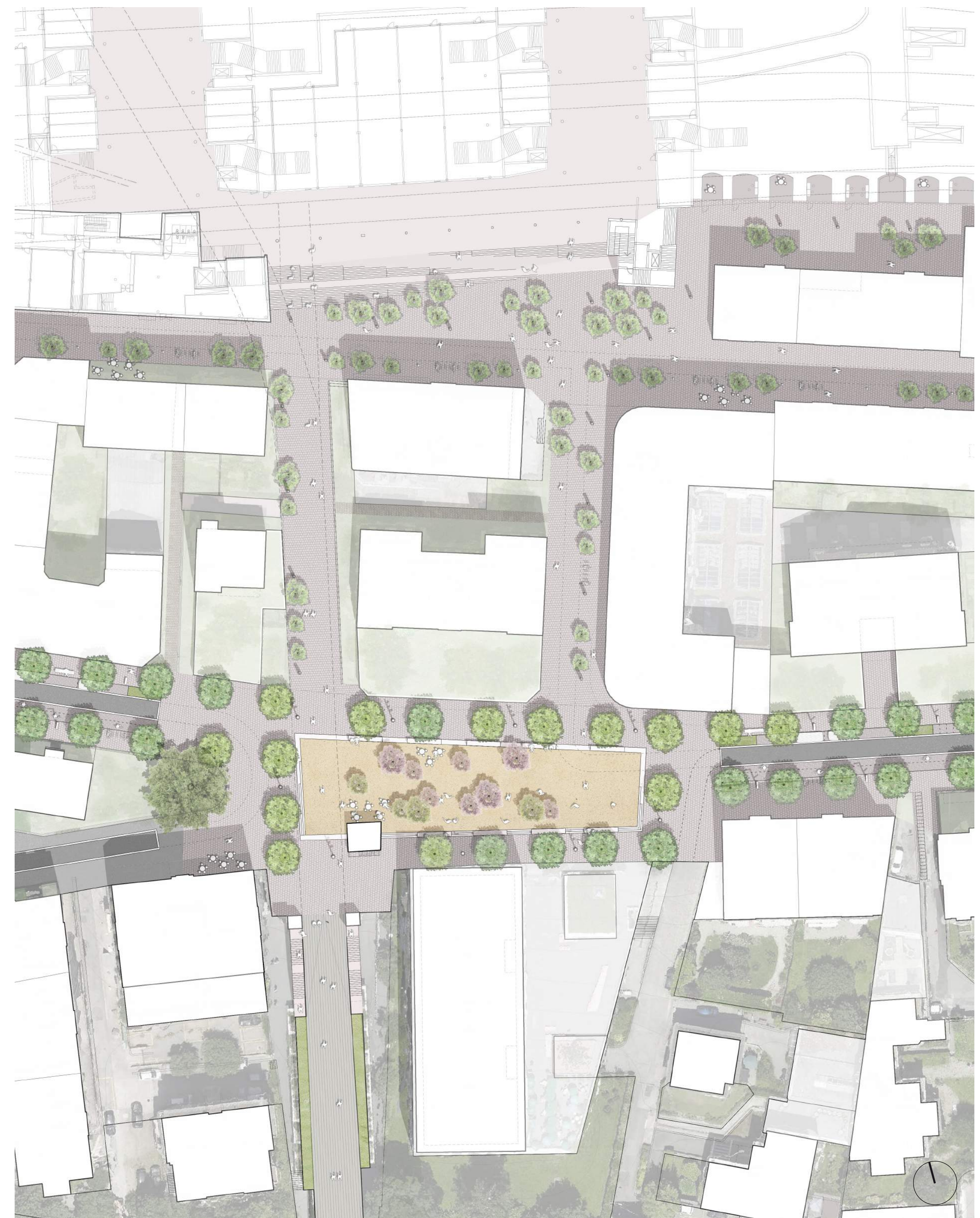
plan du périmètre de projet détaillé 1:500