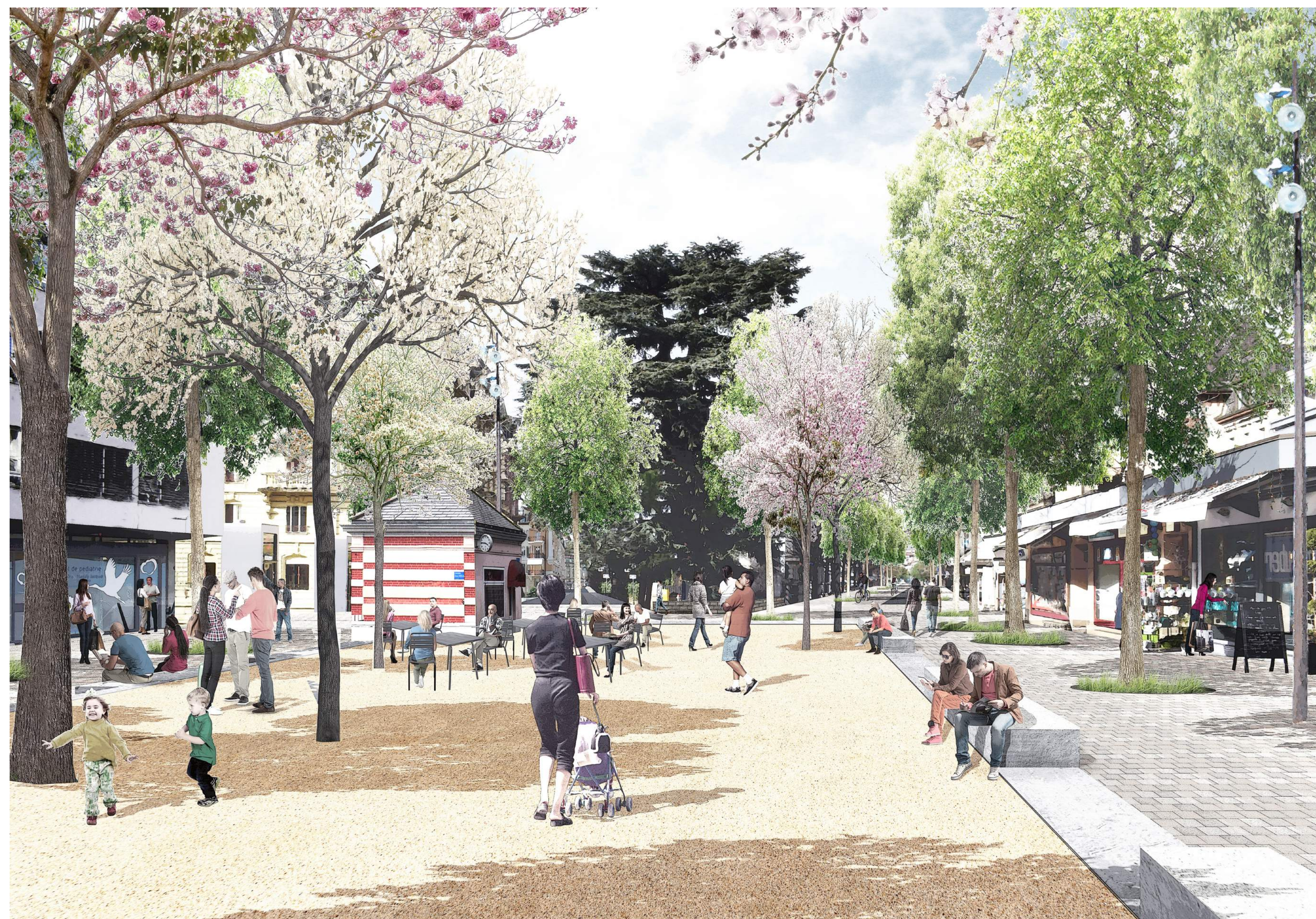
vue perspective du Square de Grancy