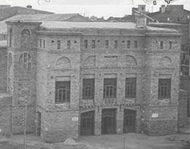
Teatre cinema el Jardí