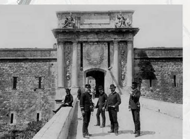
Entrada al Castell de Sant Ferran