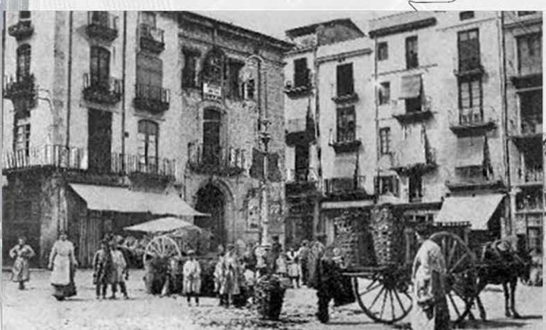
Plaça de l'Ajuntament