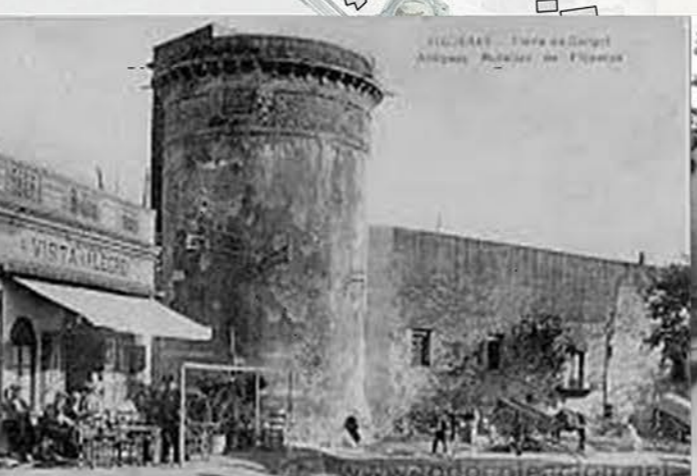
Torre Gorgot, ara torre Galatea al museu Dalí