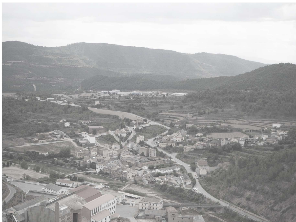
Visión de La Coromina des del Castillo de Cardona