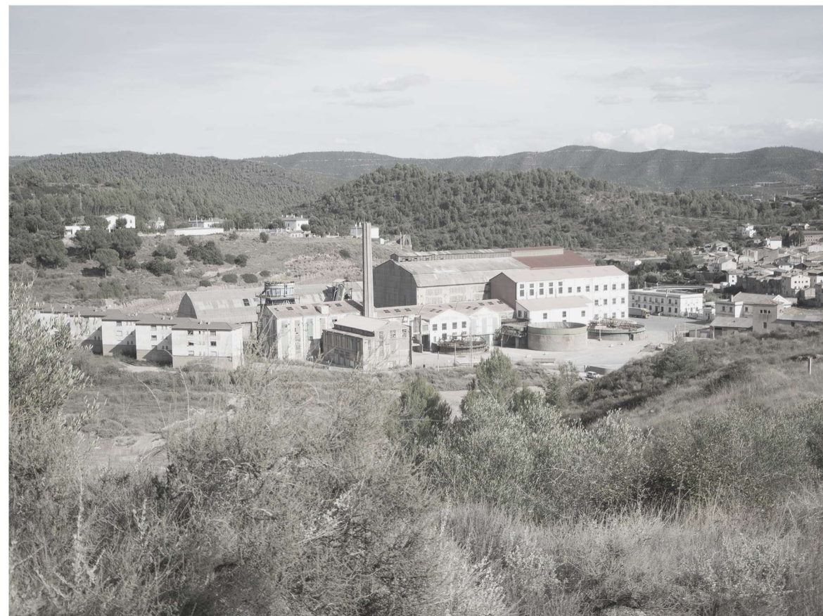
Perspectiva de la Salinera de Cardona y parte de la colonia de La Manuela