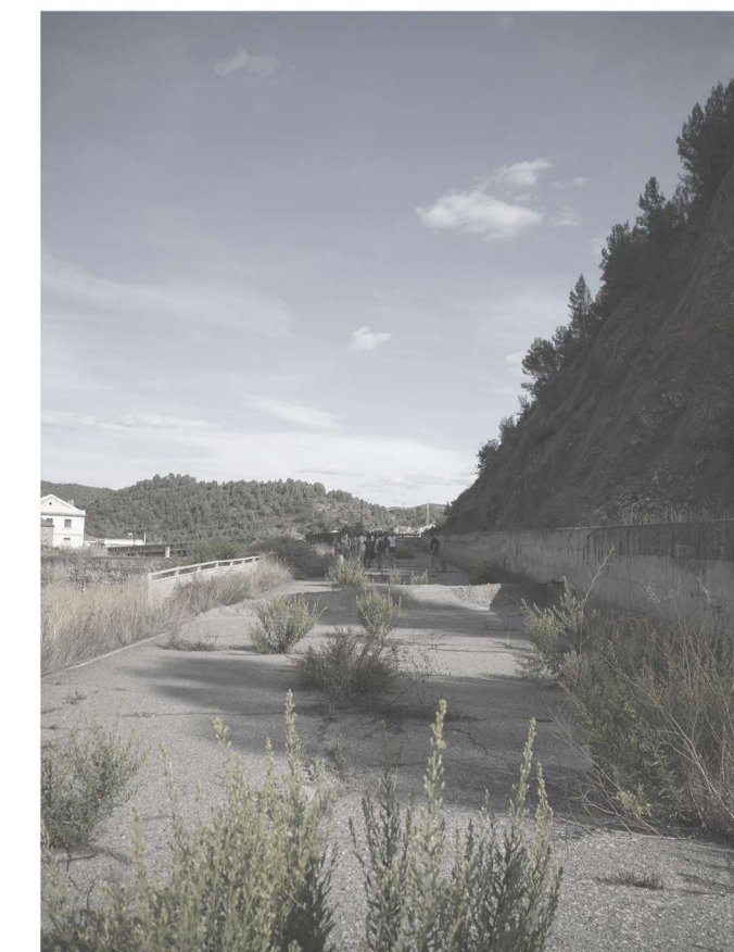
Estado antigua carretera La Coromina - Cardona