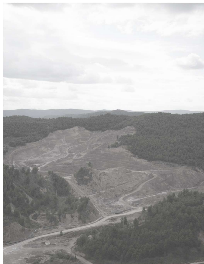
Valle salino de Cardona