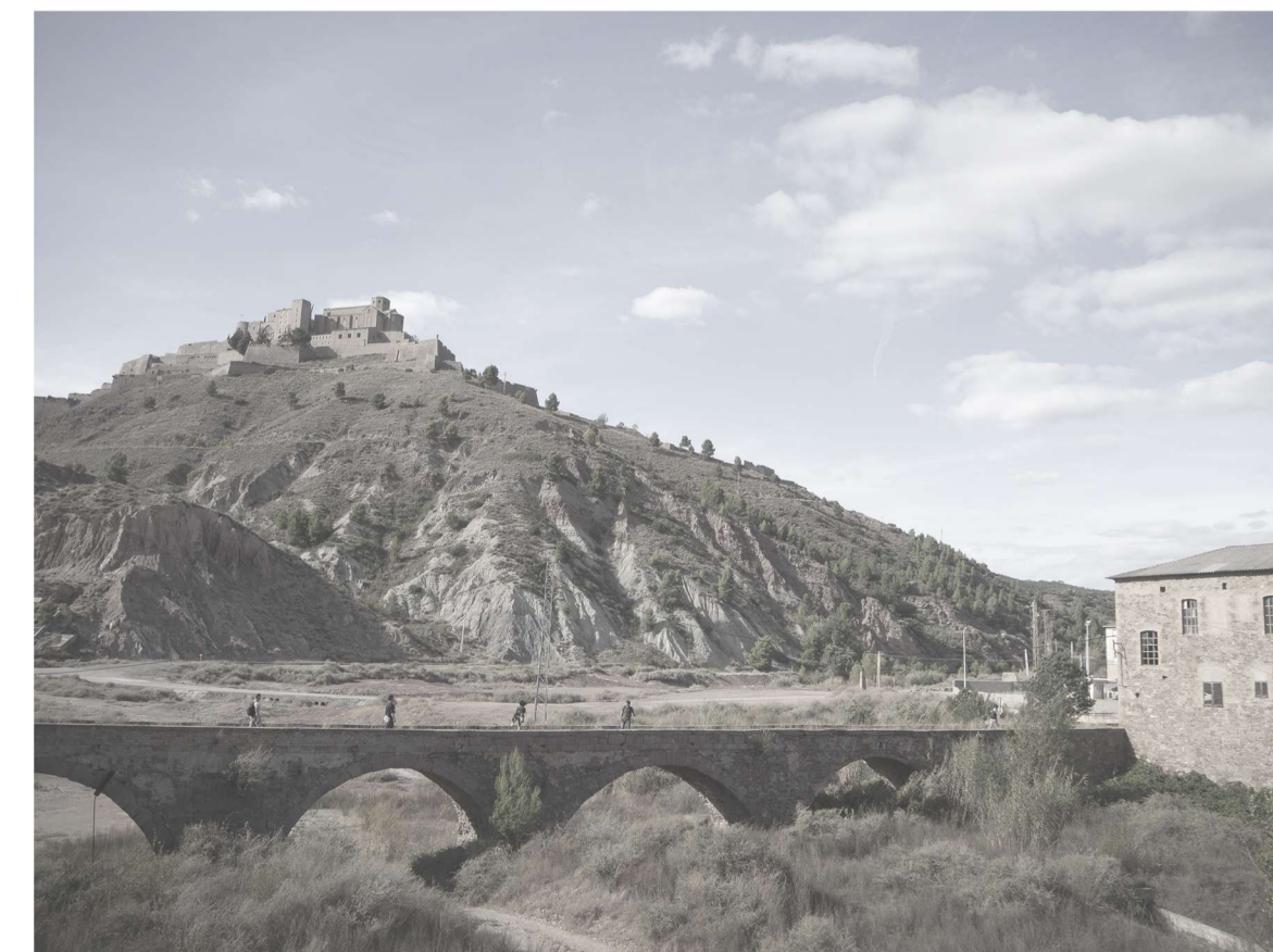
Puente histórico de La Coromina con el Molí de l'Aranyó y el Castillo de Cardona al fondo