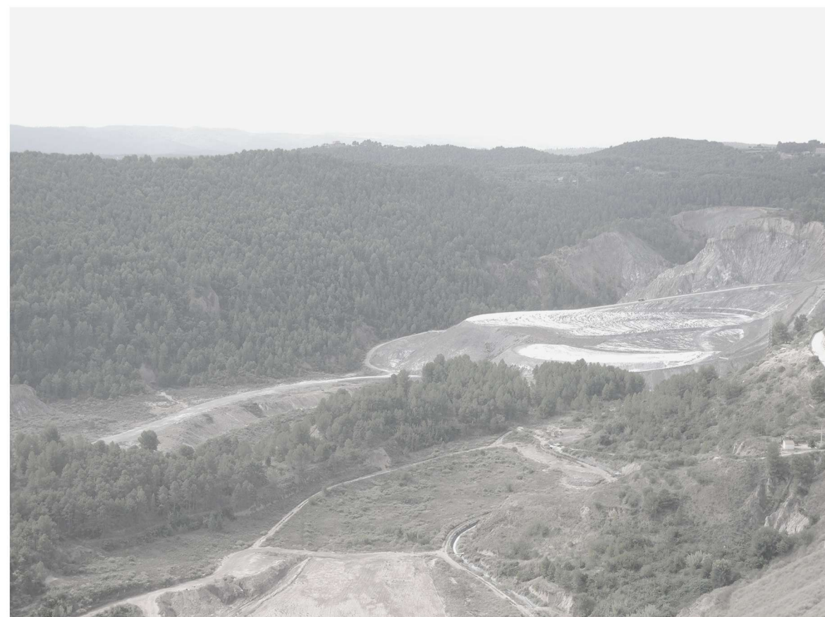
Montaña de Sal de Cardona