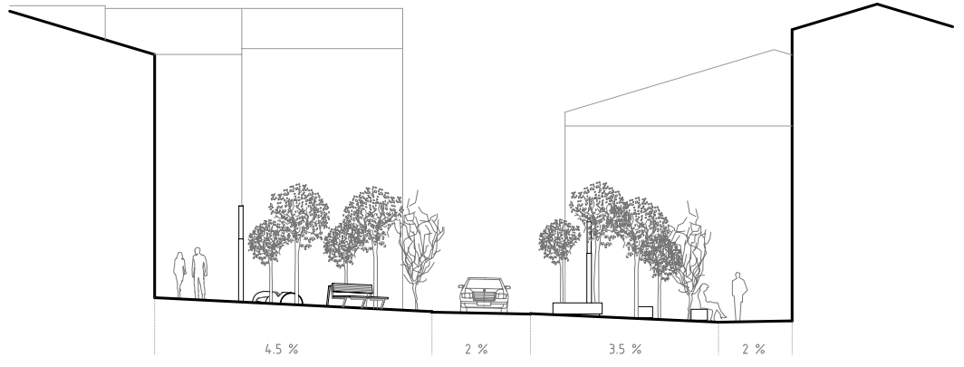
Secció 2, anant cap a Plaça Miranda

La Placeta de Sant Roc es converteix en el centre del barri de Ses Tanques del Carme. Des d'un extrem de la plaça a l'altre, cubrint l'espai definit pel perímetre de les edificacions, la superfície dedicada als veïns es multiplica, es passa dels 700m2 inicials a 1.100m2. I és que aquesta és la proposta; una estora que es desplega des del costat Sud fins al costat Nord, caient gràcies al pendent continu que el desnivell transversal provoca.