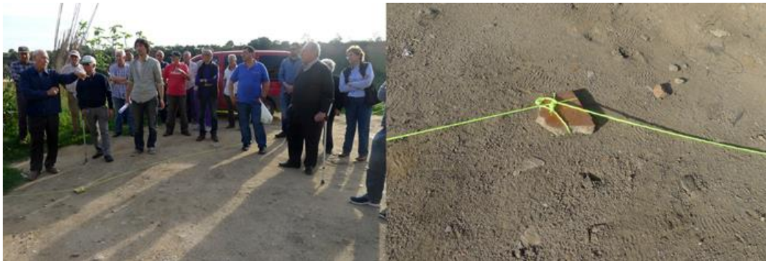
Fig. 5. Montaje del proceso de trabajo de IAP con la comunidad de regantes durante el proyecto.

Concluyendo, podemos decir que este proyecto pone en evidencia como uno de los retos que plantea el paradigma de la sostenibilidad es el de recuperar el patrimonio intangible de la gestión de los recursos, más allá del patrimonio físico, como herramienta para la transformación sostenibilista de las ciudades y su relación con el territorio. La dificultad asumida frecuentemente en las disciplinas de la arquitectura y el urbanismo de integrar los procesos participativos, se convierte así en una oportunidad de dotar a los proyectos en zonas patrimoniales de criterios solventes y avalados por el tiempo aportado por la memoria compartida de la comunidad.