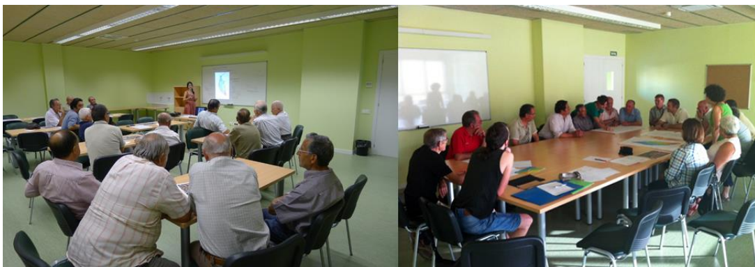
Fig. 3. Montaje del proceso de trabajo de IAP con la comunidad de regantes durante el proyecto.

Analizar el lugar desde su pasado, presente y futuro facilita a todos los agentes participantes (nosotras inclusive) la posibilidad de identificar y revalorizar el patrimonio del lugar, comprender otros casos similares, reconocer los saberes en prácticas ecológicas y activar el potencial de decisión para nuevas estrategias de autogestión en el futuro. Además, la posibilidad para un nuevo marco cognitivo sobre el lugar, un cambio de mirada y una transformación de la forma de percibir los valores del lugar.