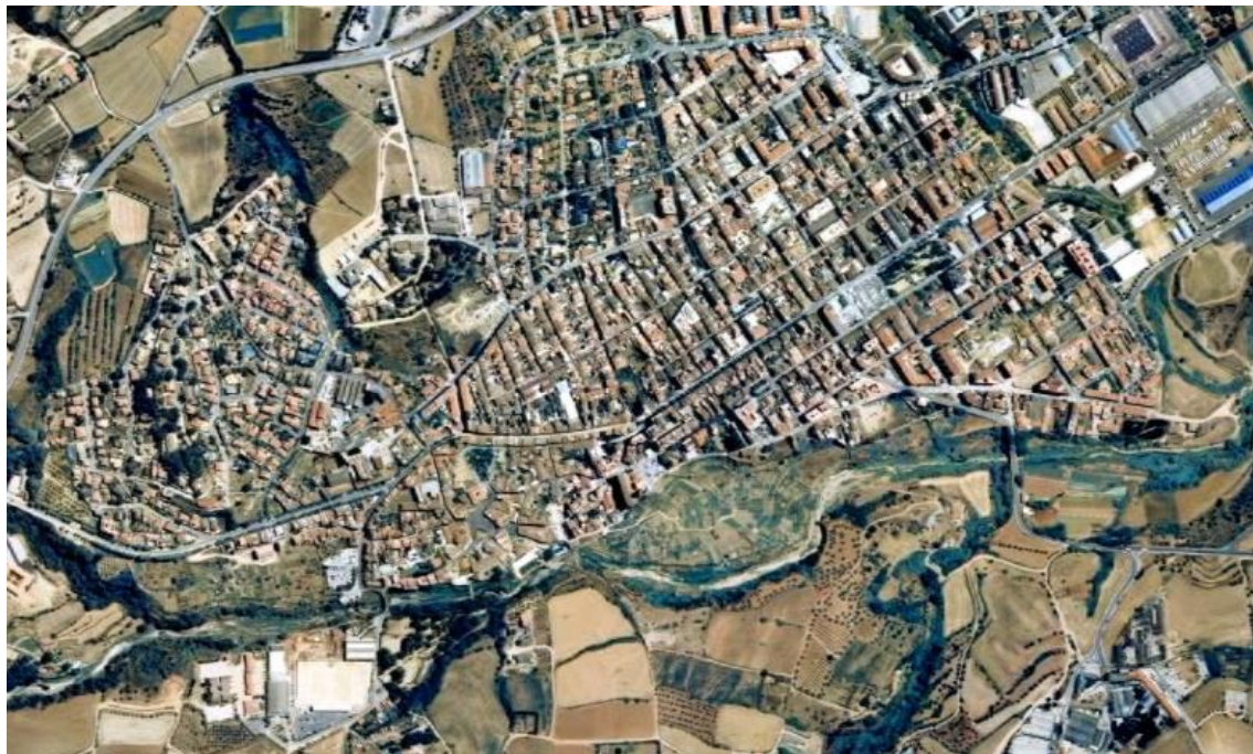
Fig. 2. Modelo de ciudad no orgánica, desvinculada de su entorno. Foto aérea de la localidad a inicios del s. XXI.