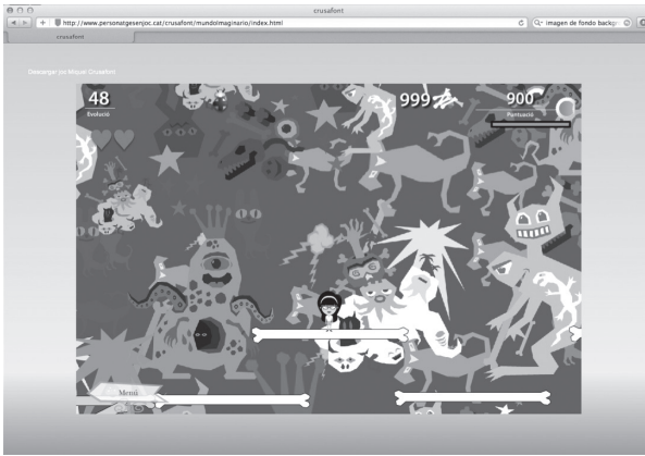
2. Pantalla que muestra la metáfora de la guerra civil Española.

En el mundo imaginario los contenidos forman parte de las reglas de juego. Por ejemplo, la supervivencia o evolución de las especies esta incluida en las reglas del juego, es decir, a medida que el alumno juega el animal evoluciona. Con ello el jugador aprende conceptos relativos a la evolución, el clima y la geografía “Fig. 3”.