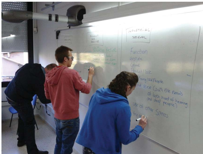
Figura 5. Representantes de tres grupos de estudiantes en los roles respectivos de usuario final, empresa de servicios y diseñador industrial, apuntando en la pizarra las mejores ideas para un brainstorming

La Figura 5 muestra una de las actividades colaborativas de los estudiantes en el seminario Human Centred Design . En esta asignatura se utiliza el modelo role playing . Los 13 estudiantes se juntan en tres grupos, cada uno con un rol específico de manera que se trabaja en clase la colaboración entre grupos (en el rol de usuario final, empresa de servicios/consultoria, diseñador industrial) y la competición (los tres grupos en el mismo rol de diseñadores industriales y compitiendo entre sí para obtener el mejor diseño).