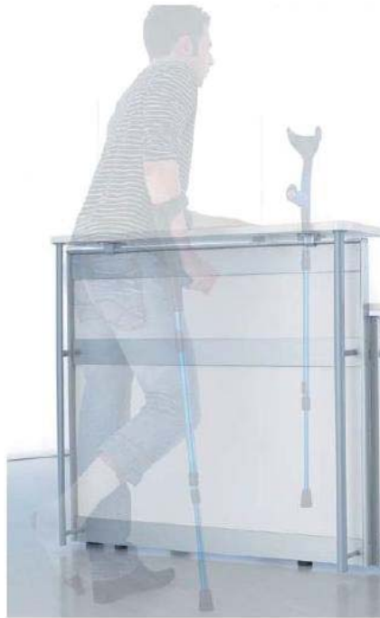
Figura 4. Acceso al mostrador para personas con movilidad reducida