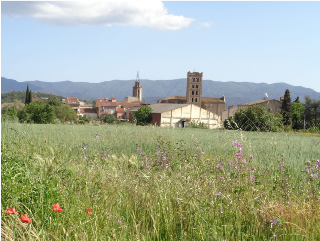
Foto 1. El campanar romànic de Sant Salvador de Breda destaca entre la població.