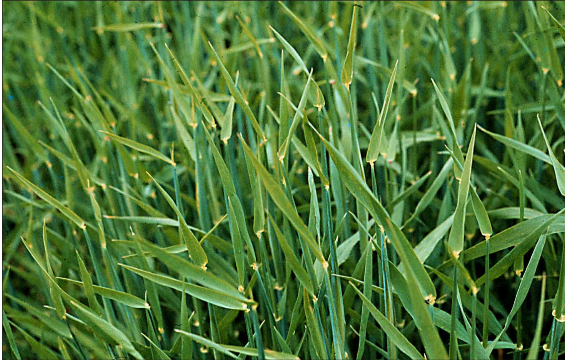
Planta a punt d'espigar