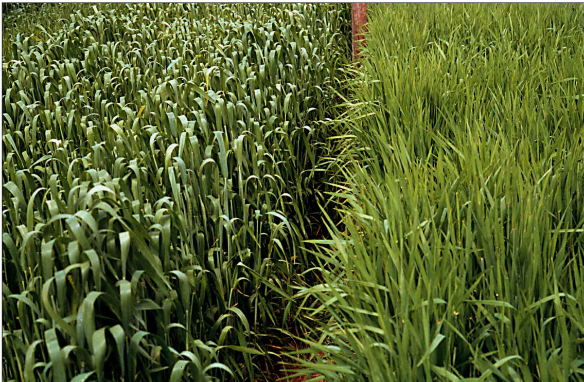
El blat (esquerra) té la fulla bandera més important que l'ordi i un color verd més intens.