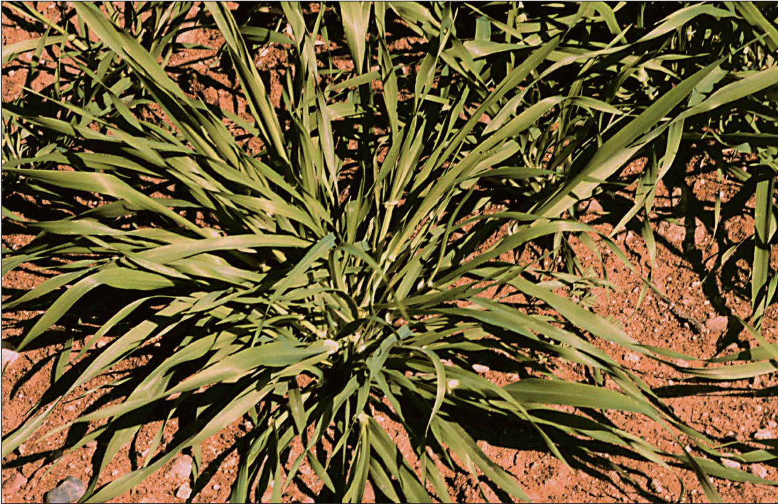
Planta durant el filloleig