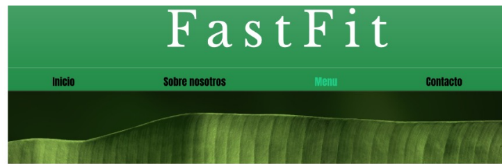
Imatge 3: Pestanya de menú de la web FastFit(1)