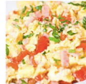
Revoltito de huevo

Revoltito de huevo condimentado con jamón dulce, tomate, cebollino y especias variadas.