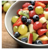
Macedonia de frutas