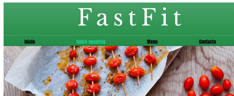
Imatge 2: Pestanya d'informació sobre el negoci i servei de la web FastFit