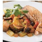
Salmón con pisto

Pollo a la plancha y una ensalada de aguacate con tomate y lechuga