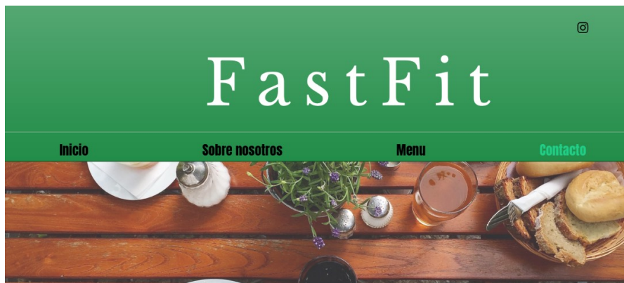
Imatge 5: Pestanya sobre localització i horaris de la web FastFit