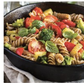
Pasta de verduras

Pasta integral con un salteado de verduras y hortalizas, específicamente brócoli, pimiento rojo, aguacate, tomate y calabaza.