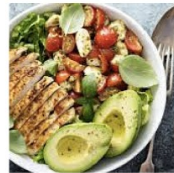
Pollo a la plancha con ensalada de aguacate

Pollo a la plancha y una ensalada de aguacate con tomate y lechuga