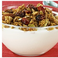
Yogurt con frutos secos