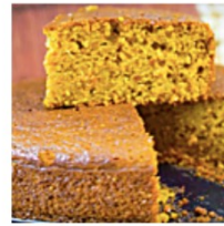
Pastel de zanahoria