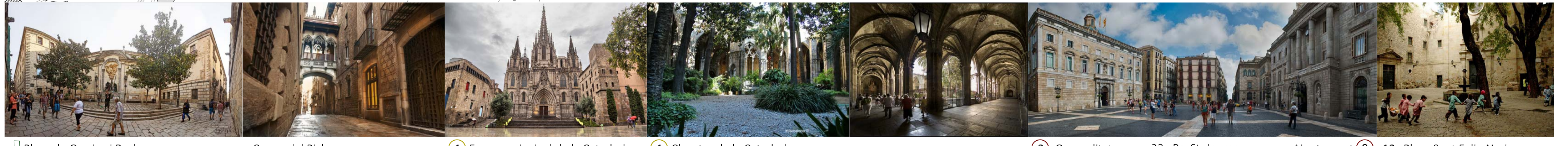
□ Plaça de Garriga i Bachs Carrer del Bisbe 1 Façana principal de la Catedral 4 Claustre de la Catedral 8 Generalitat 22 Pç. St. Jaume Ajuntament 9 18 Plaça Sant Felip Neri