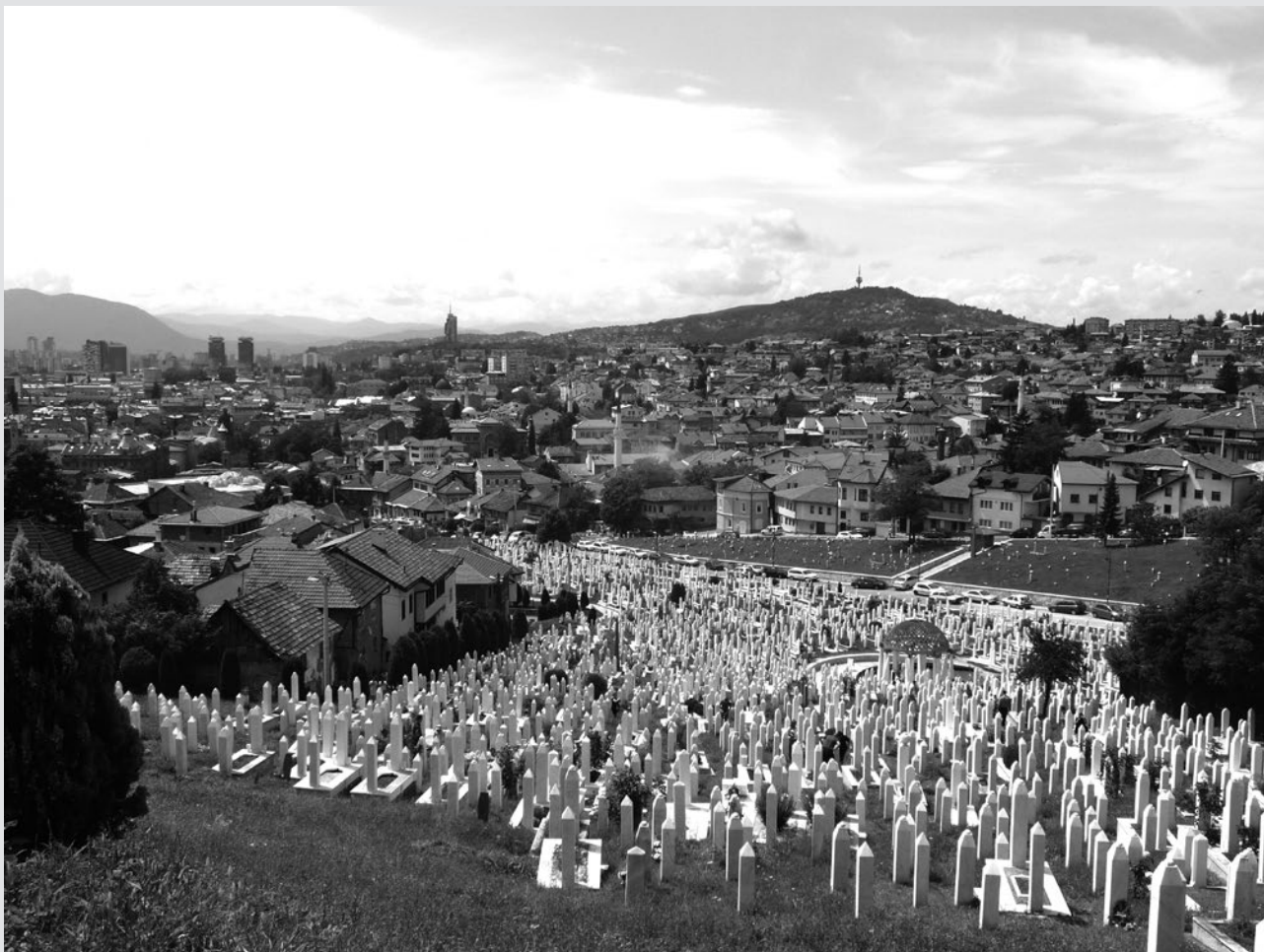
Cementiri de Kovači a Sarajevo.

Sarajevo s'estén de llevant a ponent a l'estreta vall del riu Miljacka, abrigada per les muntanyes que marquen l' skyline d'un feréstec paisatge. A l'extrem oriental s'emplaça el primer assentament, fundat el 1462 per l'imperi Otomà. La kasaba —vila— es componia d'un nucli central anomenat Baščaršija —mercat principal— i un sistema de barris residencials coneguts com a mahala . Actualment, Baščaršija manté el teixit tradicional, una teranyina de carrers i edificacions de planta baixa i planta primera amb porxos amb grans finestrals en què els comerços plens d'objectes espurnejants iicolorits desborden els límits entre l'espai públic i privat. Des d'aquest barri, els dies de ramadà alguns musulmans pugen fins a la Žuta Tabija —fortalesa groga—, on es contempla la ciutat marcada pel joc de modulacions i accents que dibuixen els minarets de les mesquites, les torres de la sinagoga i els campanars de les esglésies ortodoxes i catòli-