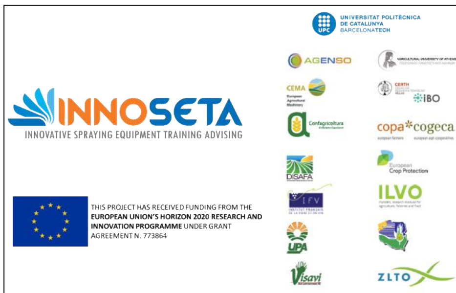
Figura 2. Partners del proyecto INNOSETA

producción. INNOSETA atenderá estas necesidades, permitiendo a los agricultores optimizar la producción de cultivos (Figura 2).