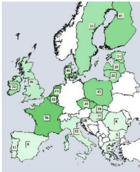
Figura 1. Mapa de Europa con indicación del nivel de formación de los profesionales de la agricultura. El verde intenso indica mayor grado de formación y el verde claro menor nivel formativo. Precision Agriculture and the future of farming in Europe. 2016. STOA IP/G/STOA/FWC-2013-1/Lot 7/SC5. Disponible en: http://www.ep.europa.eu/stoa/