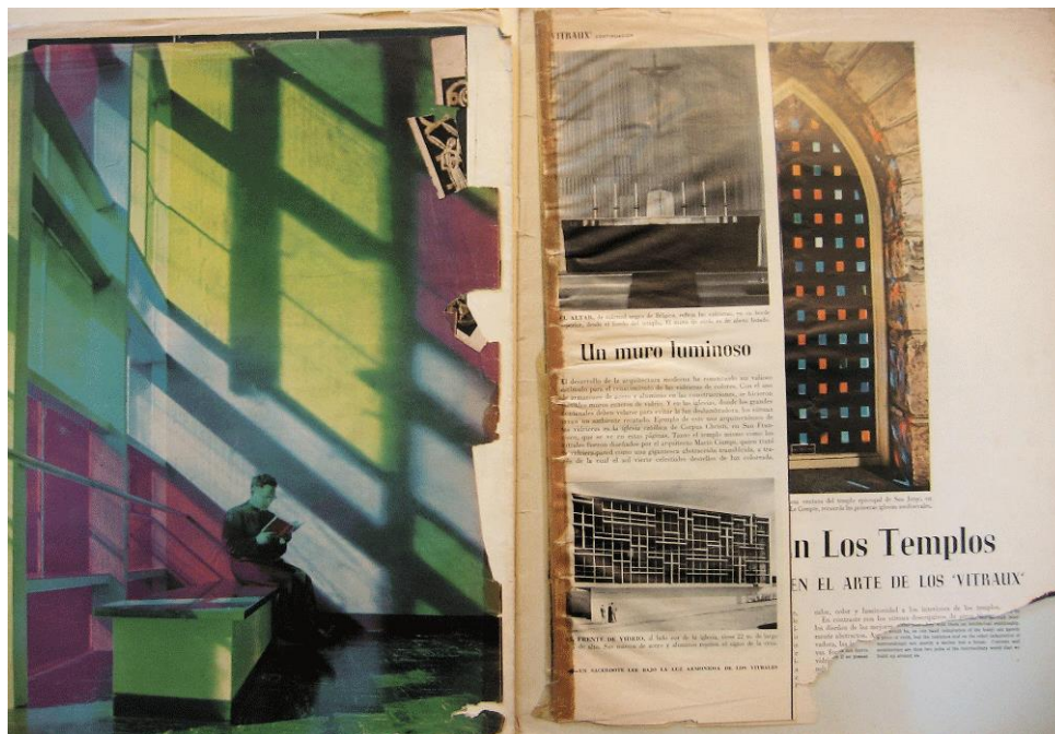
Figura 7. Recortes de revistas referentes a la técnica del vitral en la arquitectura moderna sacra hallados entre las páginas de L'art d'église: Revue des arts religieux et liturgiques , 1954, no.2