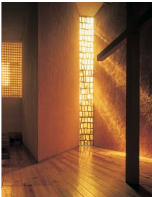
Figura 8. Interior de la Capilla de las Madres Capuchinas de Tlalpan, 1954-1959. Luis Barragán

Fuente: D.R. © LUIS BARRAGAN/PROLITTERIS/SOMAAP/2020, Switzerland.