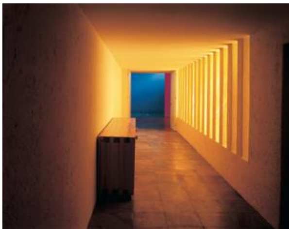
Figura 9. Imagen del interior de la Casa Gilardi, 1976. Luis Barragán