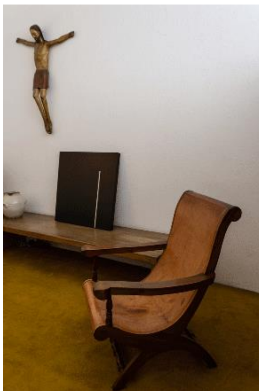
Figura 1. Interior de la Casa-Estudio, 1947. Luis Barragán