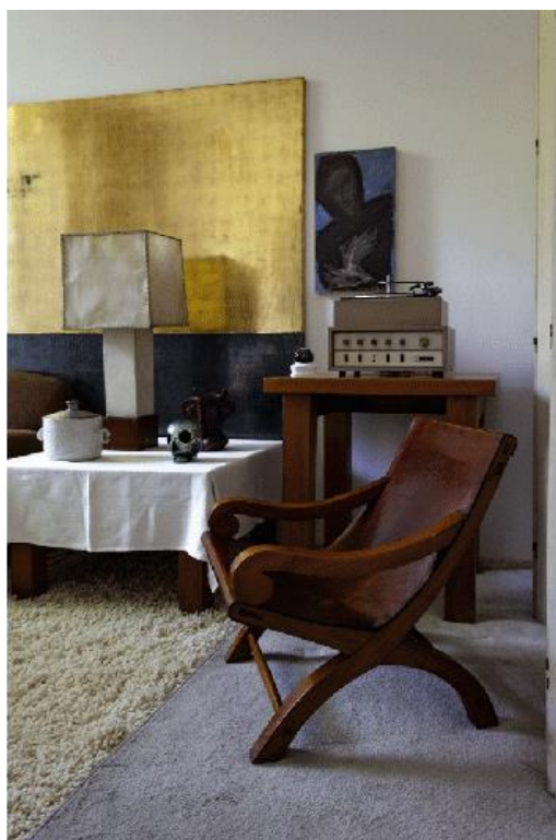
Figura 6. Reproducciones de pinturas sacras de Georges Rouault en el Tapanco y Cuarto Blanco en Casa-Estudio, 1947. Luis Barragán