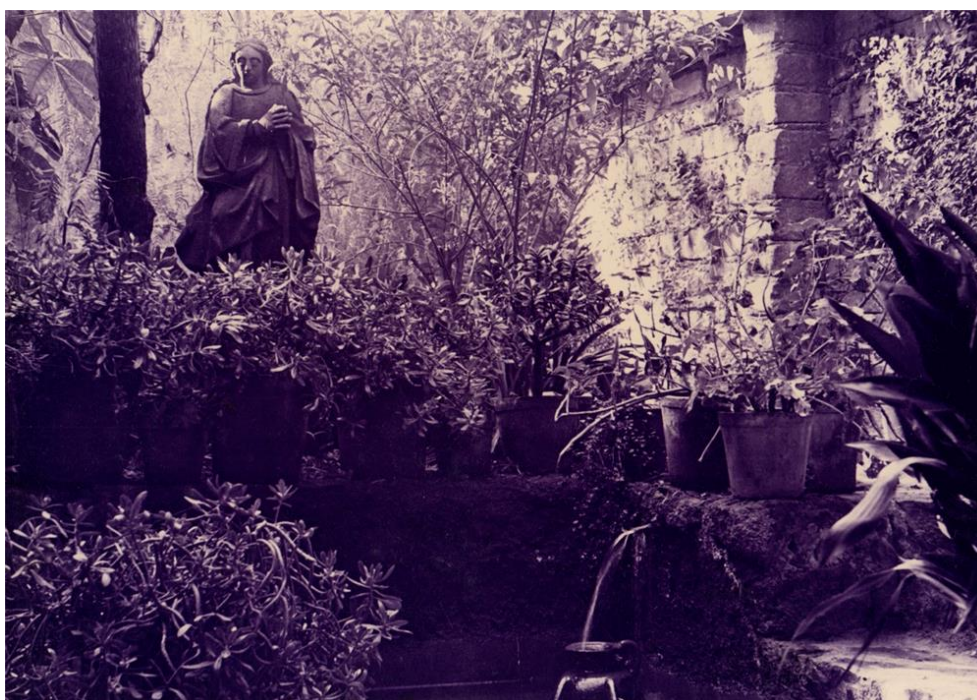
Figura 5. Espacios de transición entre el patio y el jardín, Casa Ortega, 1943. Luis Barragán