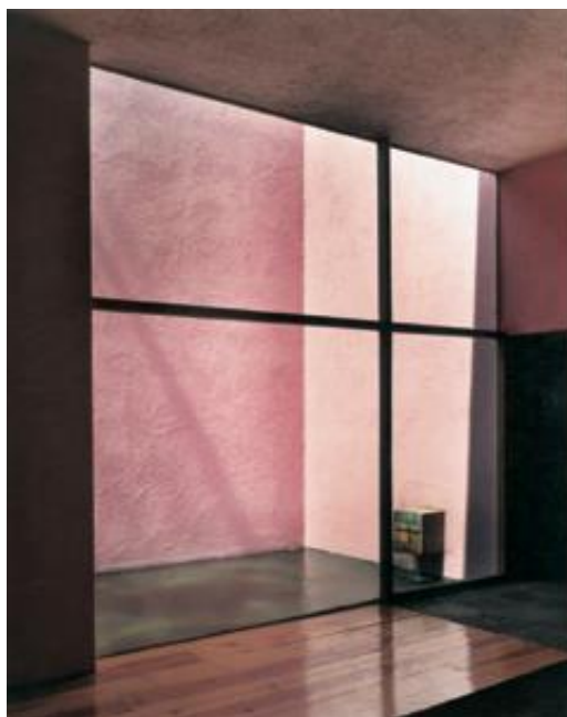
Figura 4. Casa Gálvez, 1955. Ventanal con vista a la fuente en antesala. Luis Barragán